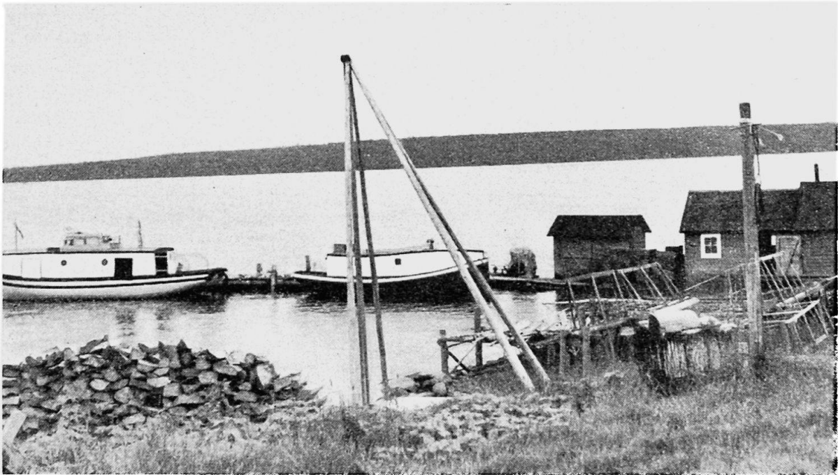
Kleine Fischereistation am Oberen See mit den charakteristischen mit Verdeck versehenen Booten (bei Apostle Islands Wisconsin)

scherei dieses Sees beträgt an die 35—40 %; Art und Zahl der Geräte werden aufs Strikteste kontrolliert. Die Fischer Ohios bringen mit 80 % den Löwenanteil des amerikanischen Fanges im See ein. Auf den günstig gelegenen Fanggründen wird dort bis an die kanadische Hoheitsgrenze hin unter so gut wie keinerlei Kontrolle intensiv gefischt. Auch die Kanadier erlauben allerneuestens in ihrem Bereich des Erie-Sees «Trapnets» neben und an Stelle der «Poundnets», aber über die Anlage und Verteilung der einzelnen Netze bestehen dort scharfe Bestimmungen. Kiemen-netze dürfen im kanadischen Bereich nur 5 Meilen von der Küste aus verwendet werden.