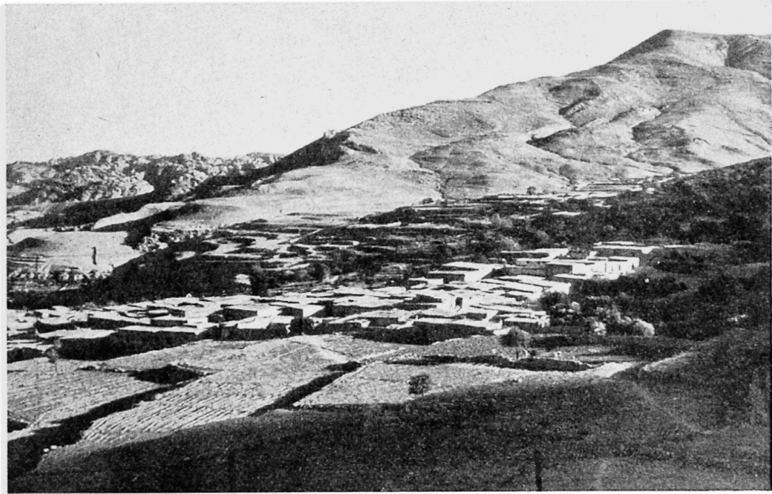
Fig. 3 Wadi Moussa. Village dont l'architecture est adaptée au terrain: toits en terrasses et cultures en terrasses

Aujourd'hui, quand on parcourt la Palestine, on rencontre un peu partout des villes de tentes, non pas les tentes noires des Bédouins, ni des tentes de touristes, mais les camps des réfugiés, ces gens qui habitaient avant la guerre les villages et les villes qui sont maintenant aux mains d'Israël. Ils auraient pu rester chez eux, dit-on, beaucoup de ceux qui sont maintenant réfugiés avaient essayé, mais ils ont dû partir à leur tour et maintenant ils attendent de pouvoir rentrer dans leurs foyers, vaine espérance, car ces foyers sont ou bien détruits ou bien occupés par des immigrants juifs. Ils végètent grâce aux secours que leur fournissent des Nations-Unies, mais combien de temps cela durera-t-il encore ?