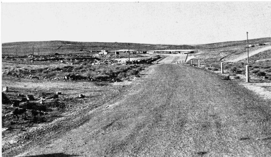
Fig. 4 Terminus de la ligne de chemin de fer. Dans le désert au Sud d'Amman, au bord du plateau transjordanien

jolie ville ancienne. Près de là, sur le Mont Nébo, d'où Moïse aurait entrevu la terre promise, l'on a dégagé les ruines d'une ancienne basilique byzantine. Plus au Sud, de petits villages se cachent au flanc des montagnes, en particulier Wadi Moussa (Fig. 3), localité d'où l'on part pour la visite de Petra, l'antique capitale des Nébatéens. Cette ville abritait des milliers d'habitants; aujourd'hui, il n'y a plus qu'un ou deux Bédouins qui, en hiver, y dressent leurs tentes. Au Nord d'Amman, l'on visite les ruines de la ville Jerash, qui sous le nom de Gerasa était une colonie romaine. Lorsque les Romains durent quitter le pays, elle fut complètement abandonnée et n'a pas été touchée depuis, les ruines en sont ainsi dans un état remarquable de conservation. Au centre se trouvait le forum d'où partait une grande avenue dallée, bordée de colonnades. Les temples étaient nombreux, tant païens que chrétiens.