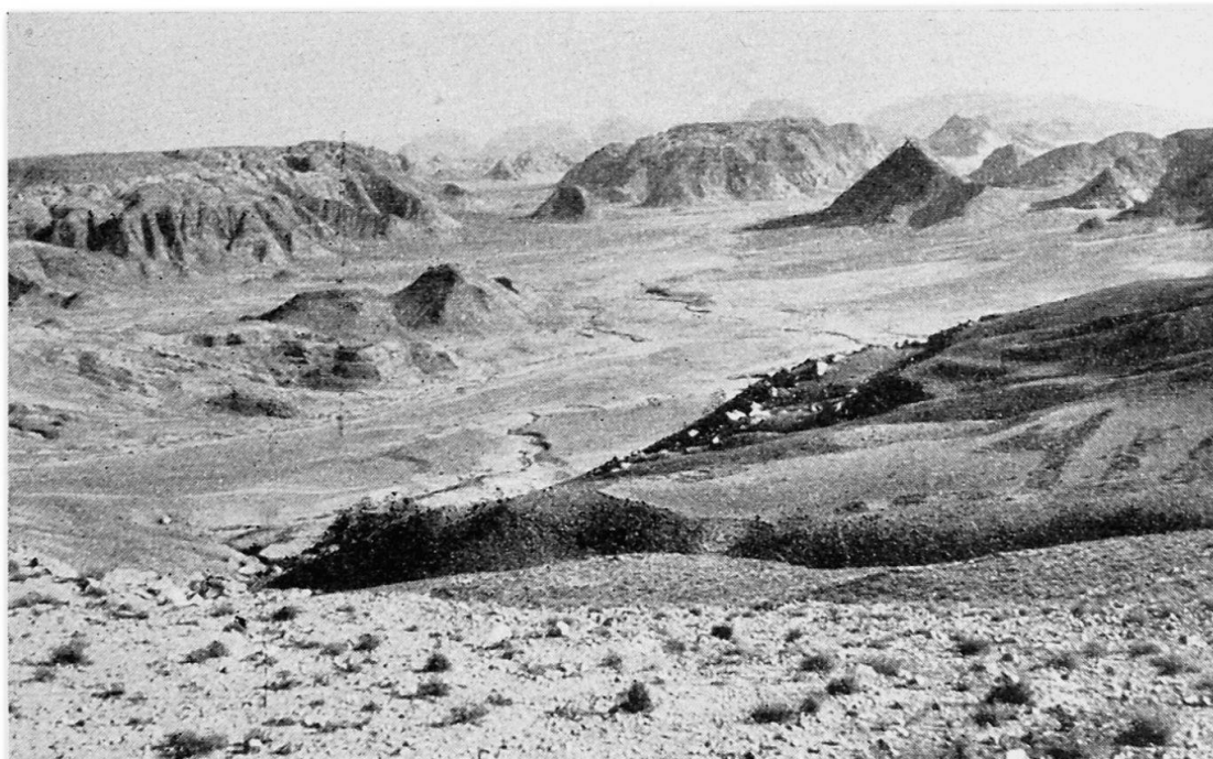
Fig. 5 Désert aux environs d'Akaba. Paysage désolé au pied des escarpements du plateau transjordanien

dressent des pics, des pyramides, de gros blocs isolés. Pas trace d'activité humaine; ni maison, ni route, ni champ; pas trace de végétation, mais dans les roches, une gamme de teintes très riches: du rose, du rouge, de l'orange, de l'ocre, du brun doré. On imagine être dans un monde fantastique.