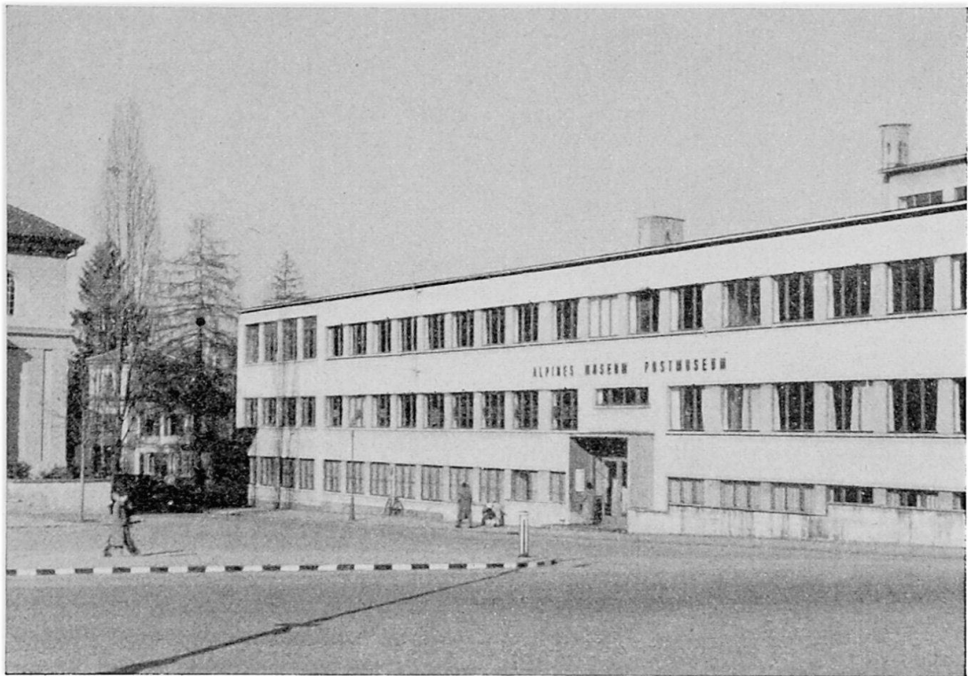
Abb. 1 Der Neubau des Schweizerischen Alpen Museums von 1934/35 in Bern, Helvetiaplatz. (Aus W. RYTZ: Fünfzig Jahre Schweiz. Alpines Museum, Bern 1955.)

gestatten – jede Überladenheit soll möglichst vermieden werden – sind kurze Texte in deutscher und französischer Sprache zur Erklärung angebracht. Überall wird versucht darzustellen, wie sich aus dem Vergangenen das Heutige entwickelt hat, und wie sich Kommendes ankündigt.