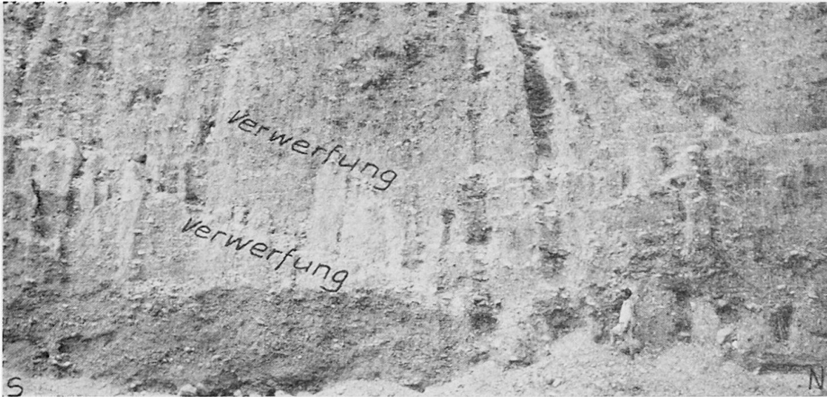
Abb. 3 Die Verwerfungen im Alluvium in Nähe der Siwalik Überschiebung.

dant auf das flach gelagerte, grobe Gerölle und Sande enthaltende Ganges Alluvium ca. 8 m weit nach Süden überschoben. In den groben Geröllen sind dabei zum Teil schöne Hakenumbiegungen entlang der Schubfläche festzustellen (Abb. 2). Unmittelbar südlich an die Überschiebung schließt sich im Alluvium eine flache Antiklinale an, in deren Kern im Flußbett noch violette und grüne Mergelschiefer der basalen Mittelsiwalikformation aufgeschlossen sind. Das hangende Flußalluvium ist von der flachen Antiklinalbildung ebenfalls erfaßt. Landschaftlich wirkt sich diese Krustenbewegung in einer auffallenden Hebung des Alluvium in jener Gegend aus.