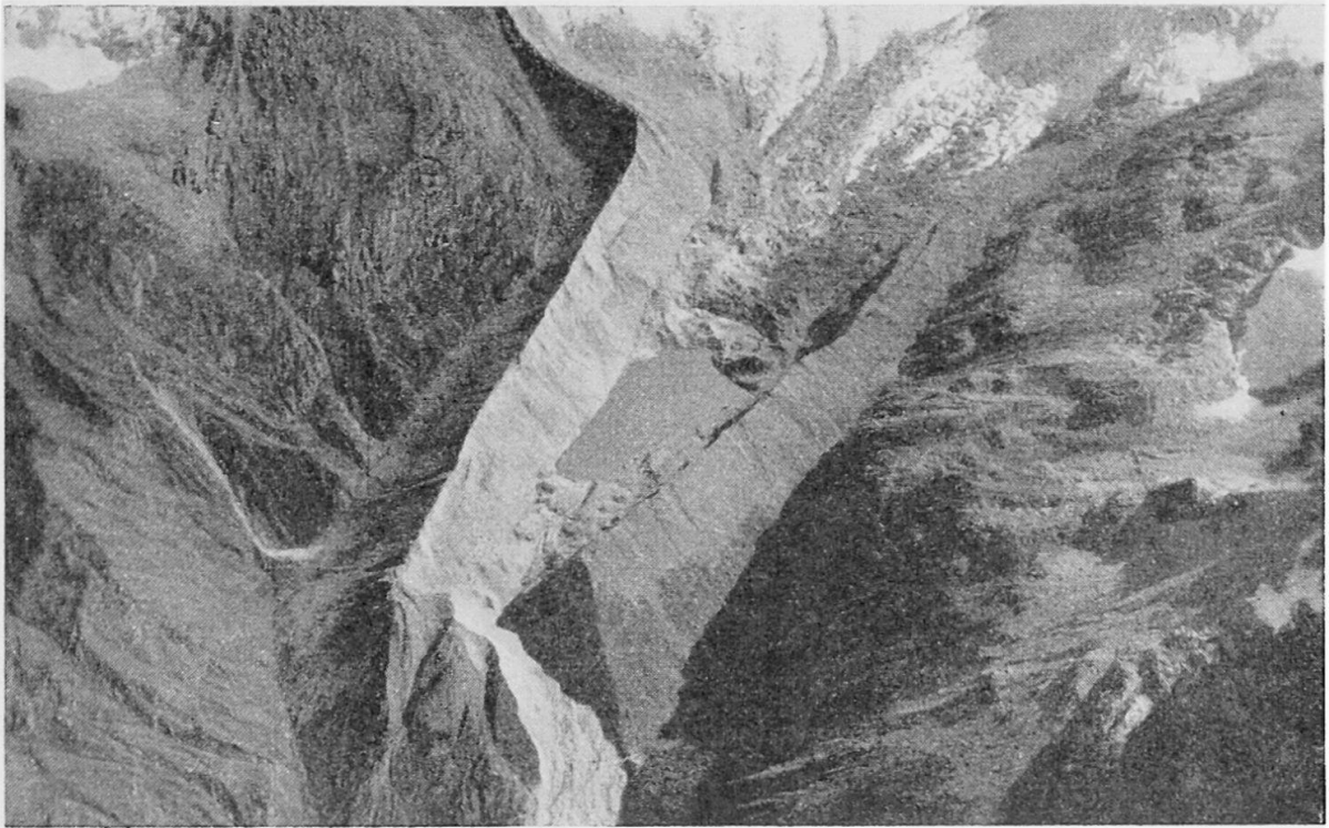
Abb. 3 Laguna Cohup in den Anden von Peru. Die Bresche in der Moräne stammt vom Ausbruch am 13. Dezember 1941

Photo Arnold Heim 8. 9. 1947 Mit freundlicher Erlaubnis des Autors dem Buche «Wunderland Peru» entnommen