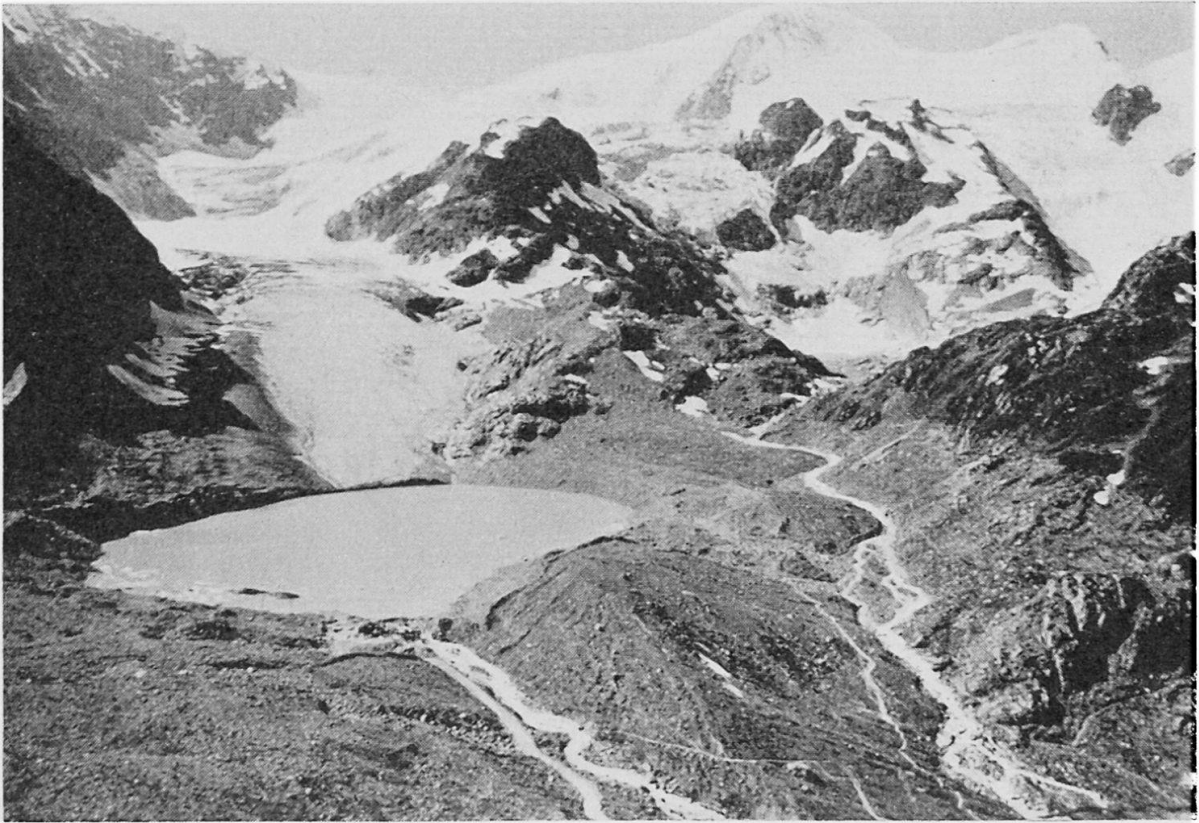
Abb. 1 Schmelzwassersee am Steingletscher, aufgenommen am 28. Juli 1956 kurz vor dem Ausbruch

teils durch eine etwas höhere Mittelmoräne des früheren Zustandes abgedämmt. Der Überlauf des Sees stieg am 21./22. August 1954 infolge wolkenbruchartiger Niederschläge derart an, daß sich der Ablauf quer durch die Moräne stark vertiefen konnte. Durch diese Bresche, die stellenweise wie ein Cañon aussieht, gelangte in kurzer Zeit eine zusätzliche Wassermenge von etwa hunderttausend Kubikmetern mit viel Geschiebe talabwärts in den Inn und trug in hohem Maße zu den Schäden an Brücken, zu Damnbrüchen und Überflutungen bei (vgl. Lit. 10 und Abb. 2).