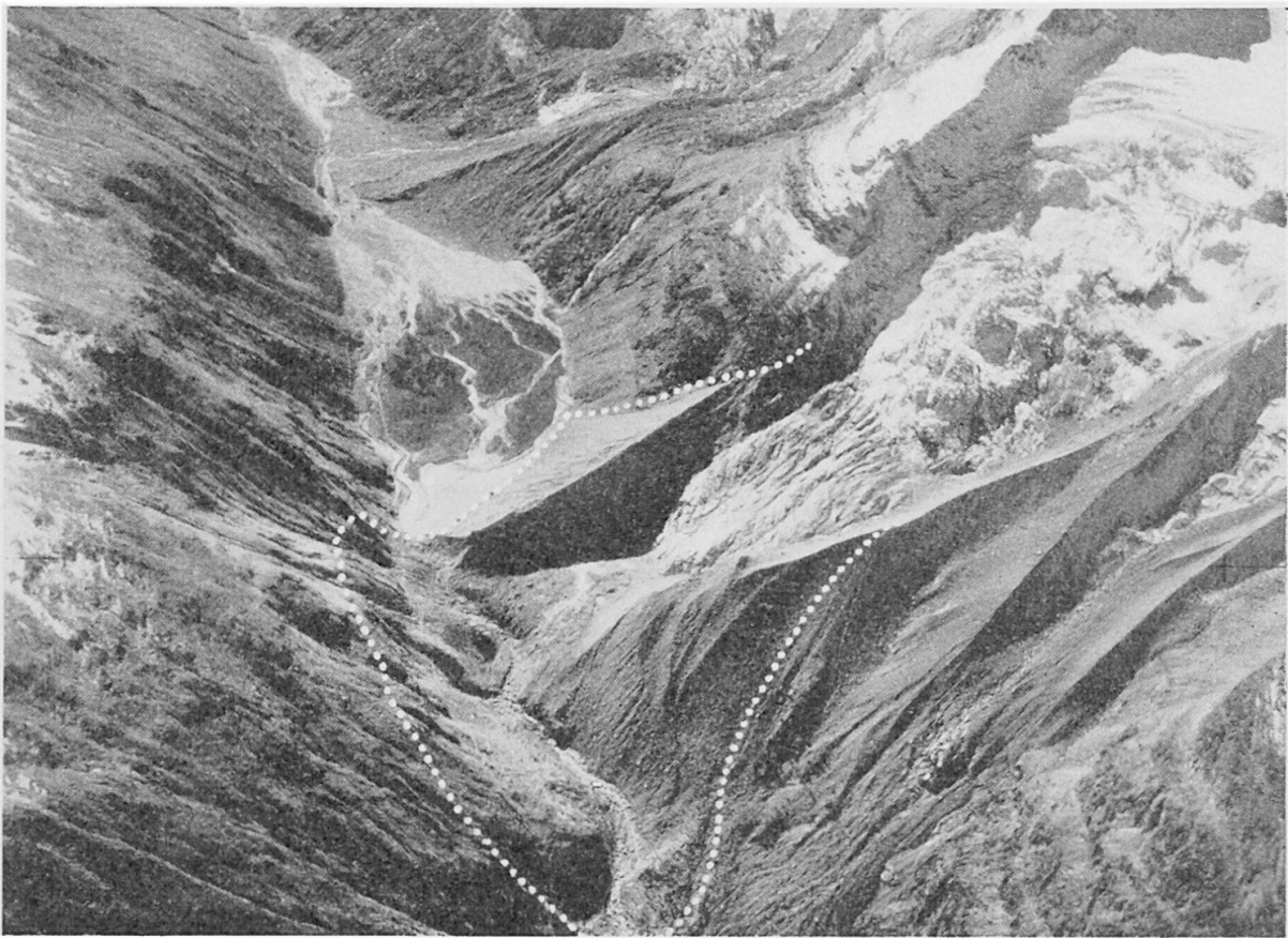
Abb. 4 Luftaufnahme der Ebene von Mattmark und des Allalingletschers. Blick nach Süden (talaufwärts). Die punktierte Linie zeigt den Maximalstand des Gletschers im Jahre 1825