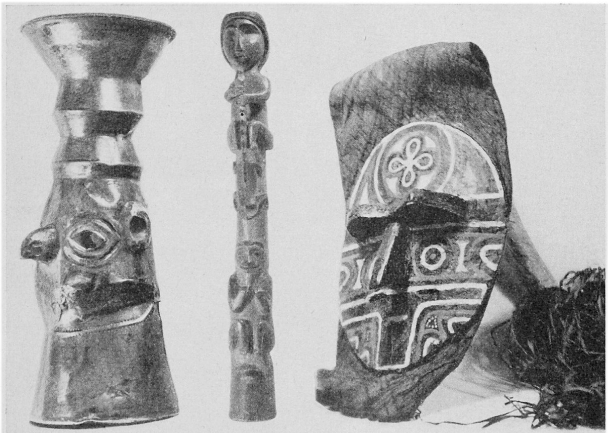
Fig. 3 Silberner Kopfbecher aus Chan-chan (Peru) 25×9,5 cm. Fig. 4 Hölzernes bemaltes Totempfählmmodell der nordwestamerikanischen Indianer. Höhe 58 cm. Fig. 5 Aus Harz und Pech verfertigte Maske der Matapis (Caquetà-Gebiet Ostkolumbiens) mit braunem Rindenstoffumhang, Maske 29×24 cm.

Räumlichkeiten. Das bisher vom theologischen Seminar benutzte Zimmer 227 wurde als Bibliothekraum eingerichtet und bereits im Sommer 1956 in Betrieb genommen. Ein im hinteren Teil der Sammlung gelegener Raum wurde als Magazin- und Arbeitsraum eingerichtet und der früher