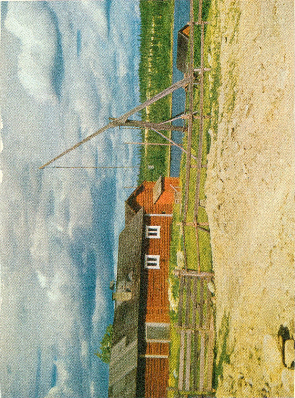
Bauernhof mit Zieh- brunnen an der Straße nach Kilpisjärvi in Lappland