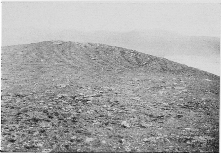
Abb. 2 Schuttstreifenböden auf dem Nuolja, in eine Mulde einbie- gend (Südexposition).

c) Die Länge der Schutt-Tropfen. Die bisher von RATHJENS und v. WISSMANN beschriebenen Schutt-Tropfen besitzen eine Länge von 20–30 m. Verfasser schätzte bei seinen Beobachtungen auch etwa reichlich 30 m. Da wir wissen, daß jene Gegend erst seit einigen tausend Jahren eisfrei ist (das Ende des Finnglazials liegt etwa 8000 Jahre zurück), können wir versuchen, die ungefähre Wanderungsgeschwindigkeit der Schutt-Tropfen am Torneträsk zu bestimmen. Bei einer einfachen Division der Maßzahl der Länge des Tropfens durch die Zahl von 8000 Jahren ergeben sich etwa 30–40 cm in 100 Jahren. Dieser Wert muß aber noch korrigiert werden, da ja die Tropfenform ein ungleichmäßiges Wandern auf der ganzen Erstreckung des Tropfens anzeigt. Im oberen Teil wäre daher entsprechend den mechanischen Strömungsgesetzen (bei geringer Strombreite) mit einer wesentlich größeren und im unteren Teil (bei größerer Strombreite) mit einer wesentlichen geringeren Wanderungsgeschwindigkeit zu rechnen. Außerdem ist zu berücksichtigen, daß bei zunehmendem Größerwerden der Stamm-Mulde auch mehr Schutt gebildet werden kann. Bei dem oben errechneten Wert handelt es sich also um eine sehr grobe Mittelwertbildung.