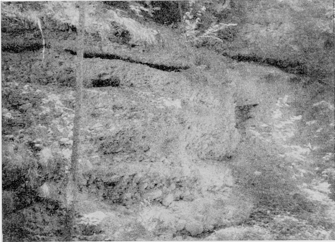
Abb. 3 Senkrechte Felswände gebildet aus verfestigten Schottern, am Wege Katzenlochbrücke-Diemtigen.

über das Gurtenstadium zu setzen sind. Da ich sowohl im Diemtigtal (GENGE, 1949), als auch im untern Simmental (GENGE, 1955) ein höheres Niveau, als das Gurtenstadium glaube gefunden zu haben, könnte man sich fragen, ob die verfestigten Kirelschotter nicht in das Interstadial Bantiger/Gurten zu setzen wären. Dem steht der Einwand gegenüber, daß die Schotter direkt auf anstehendem Felsen ruhen und soweit sichtbar, kein Moränenmaterial auf eine frühere Vergletscherung (Bantigerstadium) hinweist. Die Bezeichnung «Nachriß-Schotter» würde im weitesten Sinne auch ein solches Interstadial einschließen.