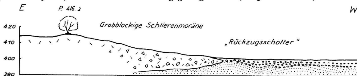
Fig. 1: Die Lagerungsverhältnisse der Schlierenmoräne bei Schönenwerd zwischen Schlieren und Dietikon im Limmattal.

Das innerste, alpennächste System von Moränenkränzen umschließt die noch zahlreich erhaltenen Mittellandseen, nämlich Sempacher-, Baldegger-, Zürichsee, Greifen- und Pfäffikersee; im Reußtal befand sich ebenfalls ein See südlich Bremgarten, der aber bereits verlandet ist. Während nach Auffassung der Schweizer Geologen (ALEXANDER WETTSTEIN 1885 u. A.) diese Moränen des Zürichstadiums als die jüngsten der drei genannten Stadien gelten, betrachtet sie J. KNAUER (1938, 1954) als überfahren und ordnet sie deshalb einem frühen Würmvorstoß, unter Vorbehalt sogar einer späten Reißphase, zu. In einer kurzen Entgegnung bin ich (H. JÄCKLI 1956) auf Grund