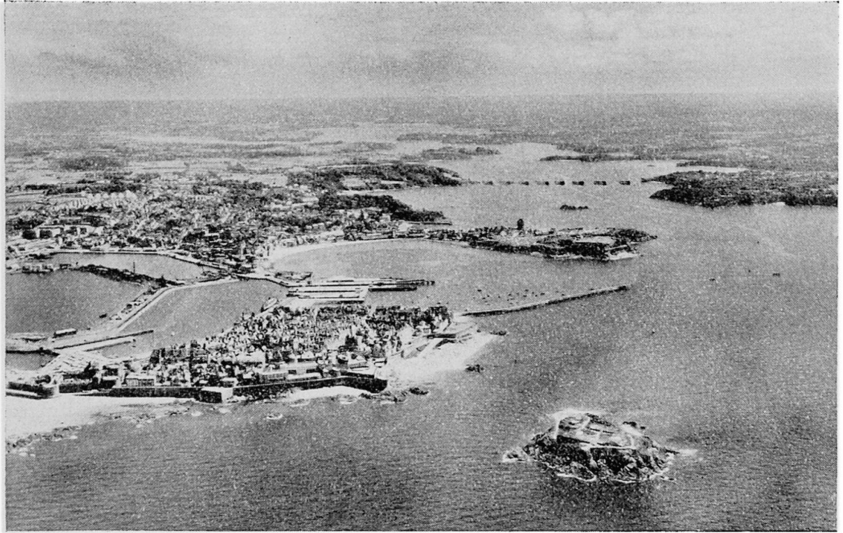
St. Malo mit Ria der Rance. --- Zukünftiger Damm für Gezeitenkraftwerk. Käufliche Photographie.

ziten gebildet seien —, kamen im Gebiet von Guimiliau und St. Thégonnec wieder die Kunsthistoriker zum Zuge. Ihr Interesse galt den bretonischen Enclos mit Triumphbogen, Beinhaus und Calvaire.