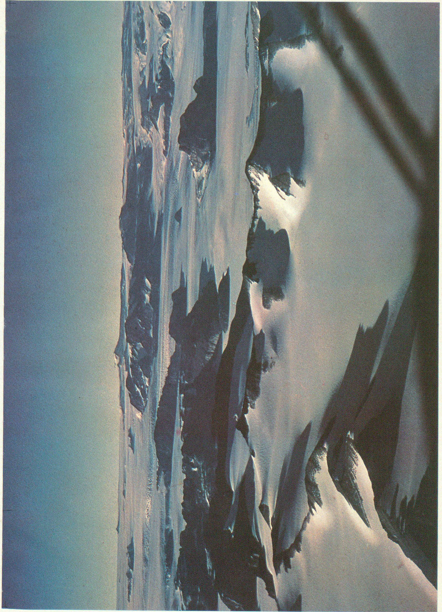
Blick auf die Hochgebirgs- landschaft zwi- schen den Ro- yal-Society- Bergen (Küste) und dem Mag- netischen Süd- pol. Die Gipfel- tur des noch unbenannten ergletscherten Gebirges liegt im 2000 m ü. M.