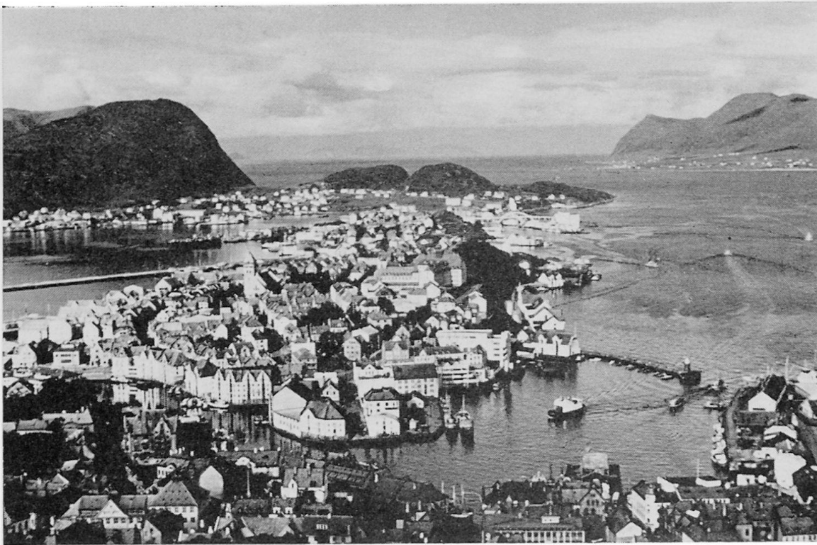
Abb. 2. Blick vom Aksla aus auf Ålesund (25 000 E.), die große Fischereistadt Norwegens (Hering).

achtenswerte Strecke von rund 100 000 km zurück. Für alle Schiffe der Hurtigrute ergibt dies fast 1,5 Millionen Kilometer oder 36 Erdumfänge.