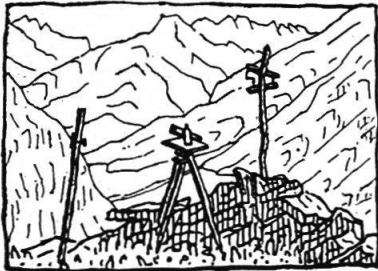
Meßtischstation Bignaroi, südwestlich von Biarca Aufnahmen 1:25000. Sommer 1936. Blick ins Ble- niotal