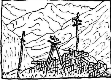
Meßtischstation Bignaroi, südwestlich von Biasca Aufnahmen 1:25000, Sommer 1936. Blick ins Ble- niotal