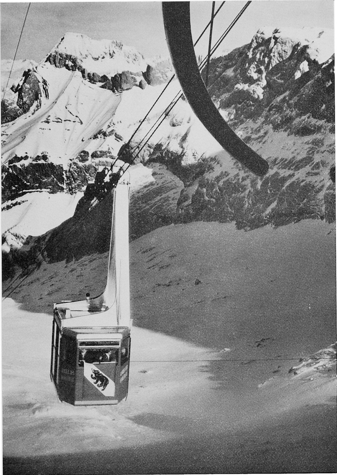
Hochgebirgsseilbahnen führen den Touristen heute bis in die Region des ewigen Schnees und ermöglichen ihm selbst im Sommer Skiabfahrten. Auf unserm Bild: Die 1963/64 in Betrieb genommene Luftseilbahn Reuschalp bei Gsteig—Diableretsgletscher.