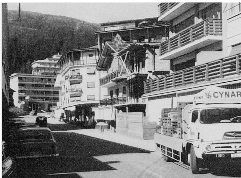
Das erst in den 50er Jahren ausgebaute Zentrum von Crans im Wallis trägt durchaus städtische Züge

Teil beträchtlichen Unterschiede zwischen der Sommer- und der Wintersaison in Rechnung zu ziehen. So kann man, trotz dem stärkern Anschwellen des Motorfahrzeugverkehrs, die sommerliche Periode als die für einen Sport- und Erholungsplatz meist weniger betriebsame bezeichnen. Das Durchschnittsalter der erwachsenen Gäste liegt im Sommer etwa in Wengen über 50 Jahren; im Winter können dort andererseits rund 85% der Gäste als aktive Sportler betrachtet werden. Andere Orte wieder tragen im Winter ein betont mondänes Antlitz zur Schau; neben dem Ski- wird dort der Après-Ski-Betrieb mindestens ebenso wichtig.