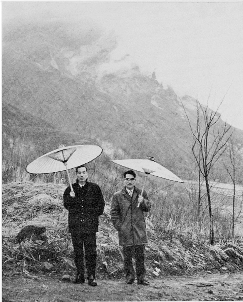
Abb. 3: Rauchender Lavadom des Shôwa-Shinzan von Westen. Betrachtungsstandort: roof mountain. Aufnahme am 6. April 1964.

natürlich gebrannte Ziegelsteine. Durch tiefe Spalten in diesem überdeckenden Material sah man da und dort die rotglühende Lava. Ihre Temperatur betrug im Maximum 980^{\circ} . Am 18. 8. 1946 wurde der neue Lavadom erstmals bestiegen. Die Untersuchung des gesammelten Materials ergab Dazit, der vom Material der Nachbardome Ousu und Kousu nur wenig abweicht.