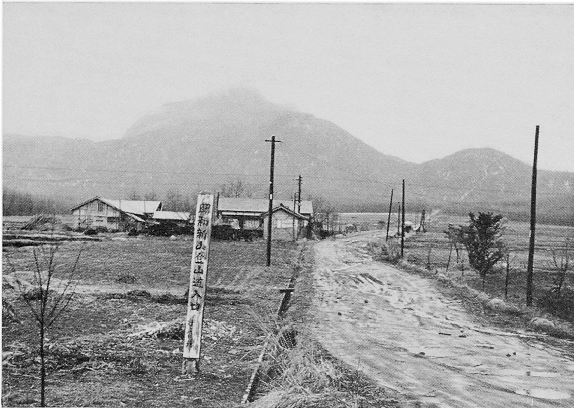
Abb. 4: Shōwa-Shinzan von Norden. Alluvialebene (150 m ü. Meer), roof-mountain (300 m ü. Meer) und Lavadom (ca. 400 m ü. Meer) sind gut zu unterscheiden. Aufnahme am 6. April 1964.