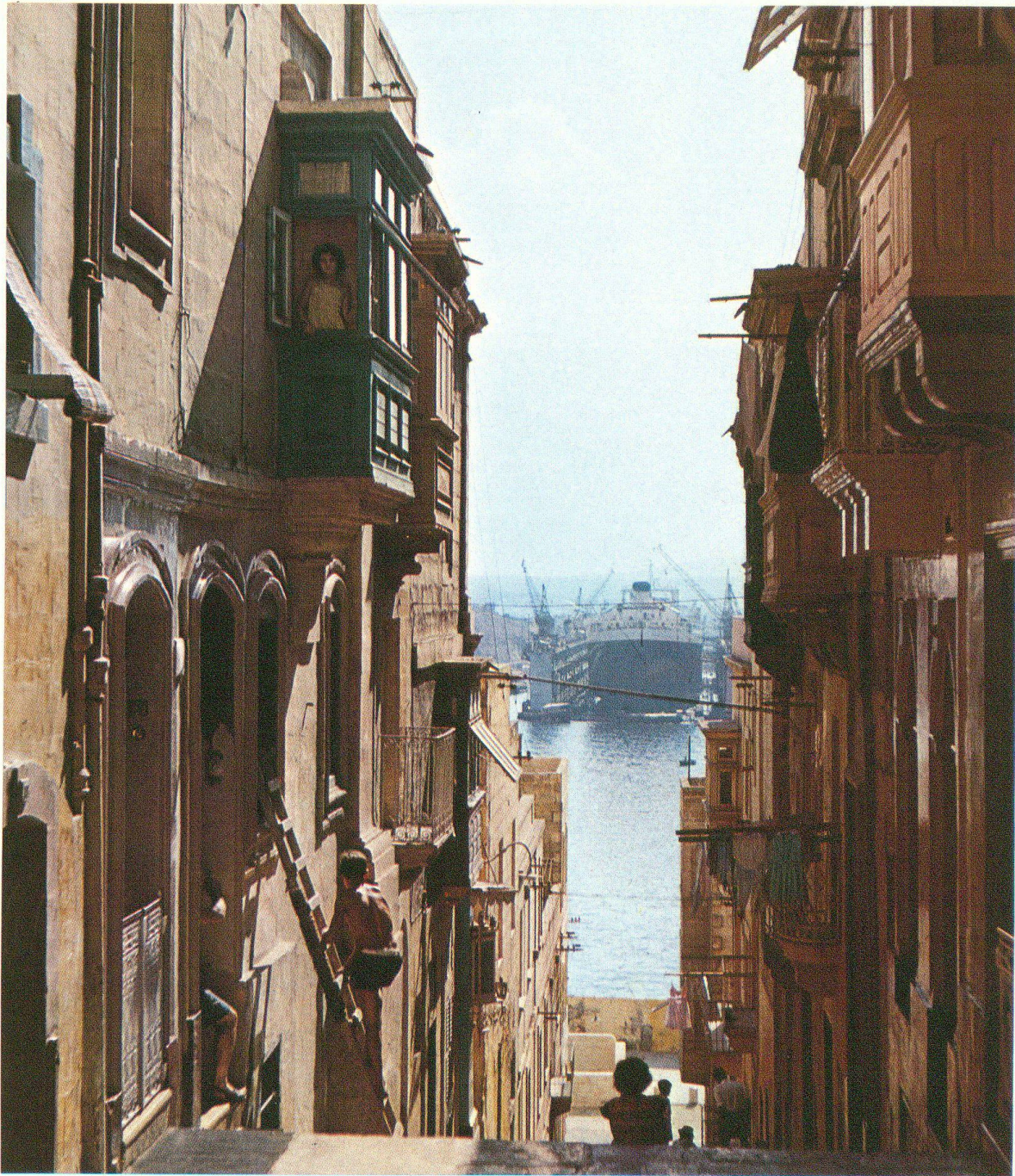
Gasse in Senglea mit Blick auf Schwimmdock

Gleich einer Theaterszenerie spielt sich hier das Leben im einfachen Volke ab, eingerahmt durch die historisch ehrwürdigen Fassaden. Der Baustil spiegelt die Formen alter Mittelmeerkulturen wider. French-Creek, die Hafenucht, vermittelt Weltoffenheit im Gegensatz zum gutbürgerlichen Kleinstadtidyll.