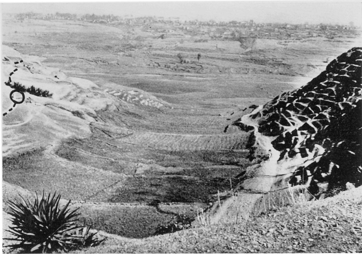
Figur 3 Kleines Seitental des Nakhu Khola, südlich Jawalakhel-Katmandu. Siehe Beschreibung im Text. Aufnahme: HB 4.3.64

die aber hier besonders eindrücklich beobachtet werden kann. Um 16.00 wurde unterhalb des Passes von Manga-Deorali angehalten.