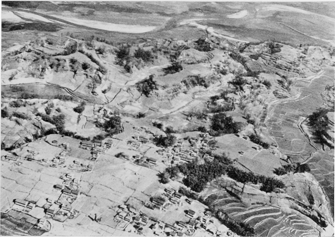
Figur 4 Flugaufnahme eines Dorfes im Valley, östlich von Katmandu. Die geologisch-morphologische Situation ist dieselbe wie in Figur 3; die Landnutzung ist im Text beschrieben. Aufnahme: HB 5.3.64

bablement alluviaux et anciens». Ich möchte beifügen, daß im allgemeinen diese Gerölle, welche einige Dezimeter im Durchmesser erreichen können, eine tief schwarze Verwitterungsrinde besitzen und mich in jeder Beziehung an Produkte arider Verwitterung erinnerten. Leider war eine Probenmitnahme nicht möglich, doch scheint mir hier der Ansatzpunkt für klimamorphologische Untersuchungen in Verbindung mit der Talgenese zu liegen.