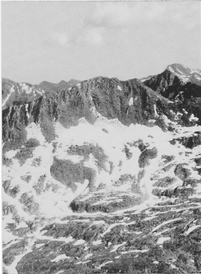
Abbildung 3. Der Blockstrom im Gipfelkar des Schenadui (V. Cadlino). Breite Zungenform mit Fließwülsten. Aufnahme 15. Juli 1964, Verfasser