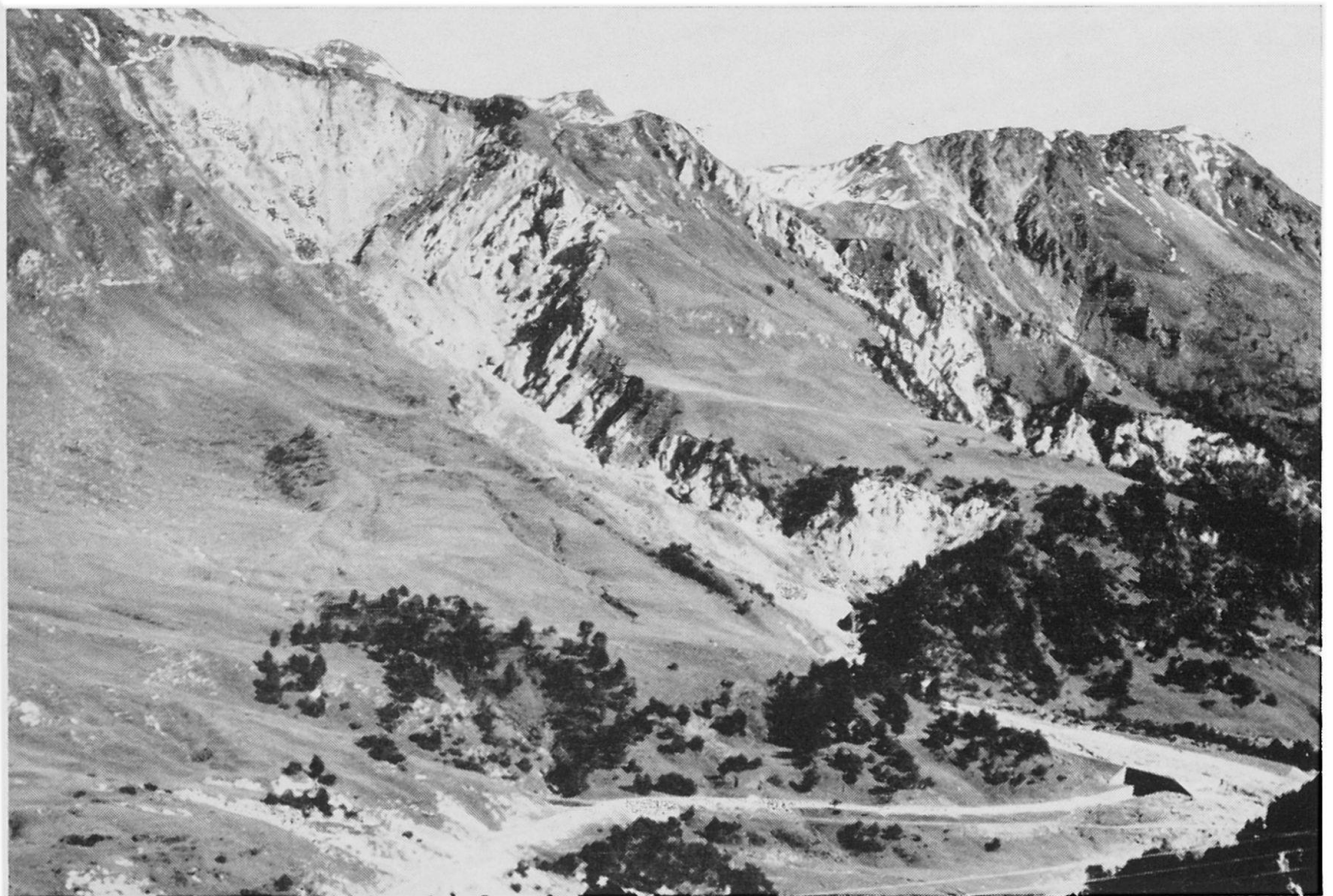
Abbildung 1. Vallone di Casaccia (Lukmanier), Wildbachtrichter und Schuttkegel, den die Paßstraße in einer Galerie quert

Vom ersten Treffpunkt Luzern aus führte bei sonnigem Wetter die Fahrt in Privatwagen durchs Reußtal auf die Oberalp, wo die letzten Teilnehmer getroffen wurden und Präsident Dr. Rudolf Salathé, Basel, mit einigen herzlichen Begrüßungsworten die Tagung eröffnete. Hier galt eine erste Besprechung dem Transfluenzpaß Oberalp und der Glaziallandschaft des Tavetsch: asymmetrische Talanlage und Seitental-Mündungsstufen mit Bezug auf Massive und Urseren-Garvera-Mulde, Epigenesen von Oberalp- und Maighelser Rhein, ausgeprägte, hochgelegene Terrassenniveaus über der linken Flanke des Tavetschtrogs, Asymmetrie der Seitentäler: kurze, nordseitige gegenüber bedeutend größeren Trögen der Südseite [z. B. Val Val im N und gegenüber Val