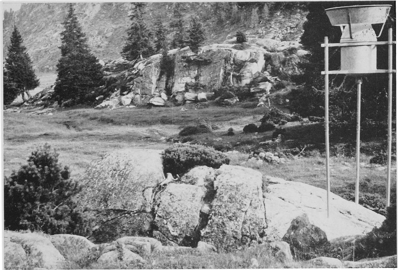
Abbildung 2. Niederschlagstotalisator in den Rundhöckern von Pian Segno (Lukmanier)

Maighels], Blockstrom im NE exponierten Gipfelkar des Piz Cavradi 2612 m, wohlausgebildete Karnischen [z. B. jene des Rheinursprungs, dem Lai de Tuma].