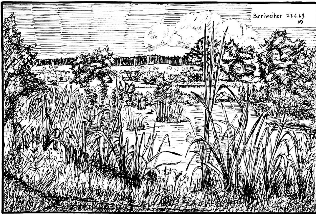
Figur 1. Der aus einer alten Torfgrube entstandene Birriweiher gilt wegen der zahlreich hier brütenden oder durchziehenden Vogelarten als Naturschutzobjekt

einen langen, leicht gebogenen Schnabel und kann seine Nahrung nur in Feuchtriedwiesen mit hohem Grundwasserstand finden und aufnehmen. Als weiterer Bodenbrüter haust der etwa krähengroße Kiebitz in einem unkultivierten Gebiet. Bei meinem Kontrollgang am 23.5.69 kreisten drei dieser Vögel über mir und stießen so lange ängstliche Warnrufe aus, bis ich das Brutrevier wieder verlassen hatte. Daß die Reußebebene botanisch, zoologisch, landschaftlich über die angrenzenden Kantone, den Kanton Aargau, über die ganze Schweiz hinaus, europäische Geltung beanspruchen darf, geht daraus hervor, daß sich der World Wildlife Fund auf internationaler Basis aktiv zum Schutze dieser Werte eingeschaltet hat, damit durch möglichst große Landkäufe naturnahe Landschaftsteile bewahrt werden können.