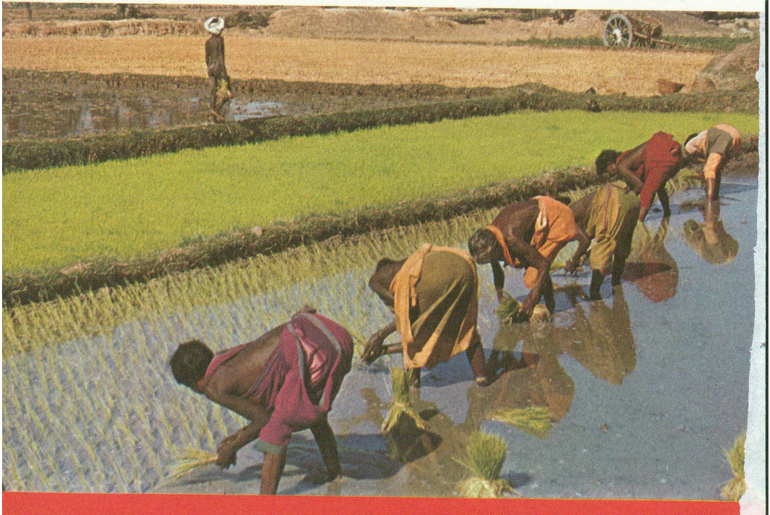
Bewässertes Kulturland der immerfeuchten oder periodisch-feuchten Klimate: Reisfeld. Farbton 4.1 (Indien)