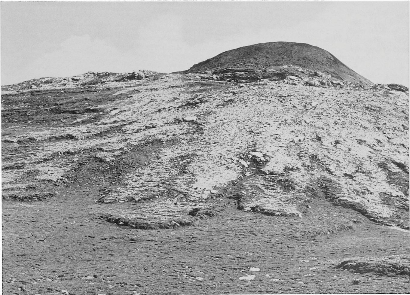
Abbildung 1. Gesamtansicht des Munt Chavagl (2541 m, Koordinaten 814.000/169.675). Die untern Hangpartien erhalten ihr morphologisches Gepräge durch die Erdströme (zungenförmige Ausläufer der Solifluktiionsdecke, die den Hang überzieht). Diese sind teilweise auch in den verflachten Hangfußbereich vorgestoßen (z. B. rechte untere Bildecke). Die einzelnen Erdströme heben sich durch ihre Steilränder deutlich gegeneinander ab. Ältere sind von jüngern überflossen worden. Durch Verbindung der Seiten- und Stirnbegrenzungen lassen sich gleichaltrige Einzelformen zu Solifluktiions-Teildecken (Erdstromgenerationen) zusammenfassen

Die graugefärbten Solifluktiionsmassen ( S_1 bis S_5 ) zeichnen sich durch einen hohen Anteil von Skelettmaterial aus ( > 2 mm). In der Korngrößenzusammensetzung ihrer Feinerde ( < 2 mm) herrscht die Silt-(=Schluff-)Fraktion (2–60 \mu ) durchwegs vor. Nach Fließ- und Ausrollgrenze (bestimmt gemäß Atterberg) beurteilt, geht das untersuchte Material schon bei geringfügigem Wassergehalt in den fließfähigen Zustand über, und der Plastizitätsbereich ist im allgemeinen recht eng. Morphometrische Untersuchungen ergaben eine mehr oder weniger ausgeprägte Kantenrundung bei den größeren Komponenten des Detritus. Die erwähnten Merkmale genügen bereits, um das vorliegende Material als Solifluktionsschutt zu kennzeichnen. Die Bewegungsvorgänge selbst haben sich jedoch auch unmittelbar ausgeprägt, nämlich in der solifluktionstypischen Einregelung. Bezüglich der Falllinie als Leitrichtung