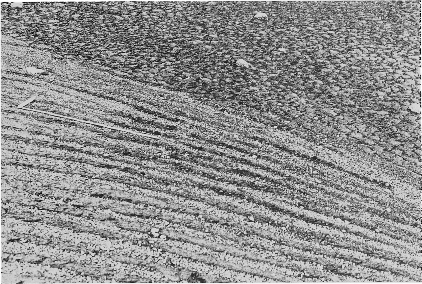
Abbildung 1. Gesteinsgrenze südwestlich Santa Clara, 4850 m ü. M., ( 77^{\circ} 9' \text{ WL} , 11^{\circ} 37' \text{ SB} ). Vorne sind Erdstreifen auf grauem Kalk, hinten Zellenböden auf rötlichem Kalk

Oft fand ich hingegen ausgedehnte Hänge, die ungeachtet der Wechsel von Kalk zu Sandstein, Quarzit oder Schiefer voller Erdstreifchen waren. Eine Gesteinsgrenze bewirkt nicht unbedingt einen Wechsel der Solifluktionsform. Es ist lediglich festzuhalten, daß jedes Material die Solifluktion spezifisch beeinflusst.