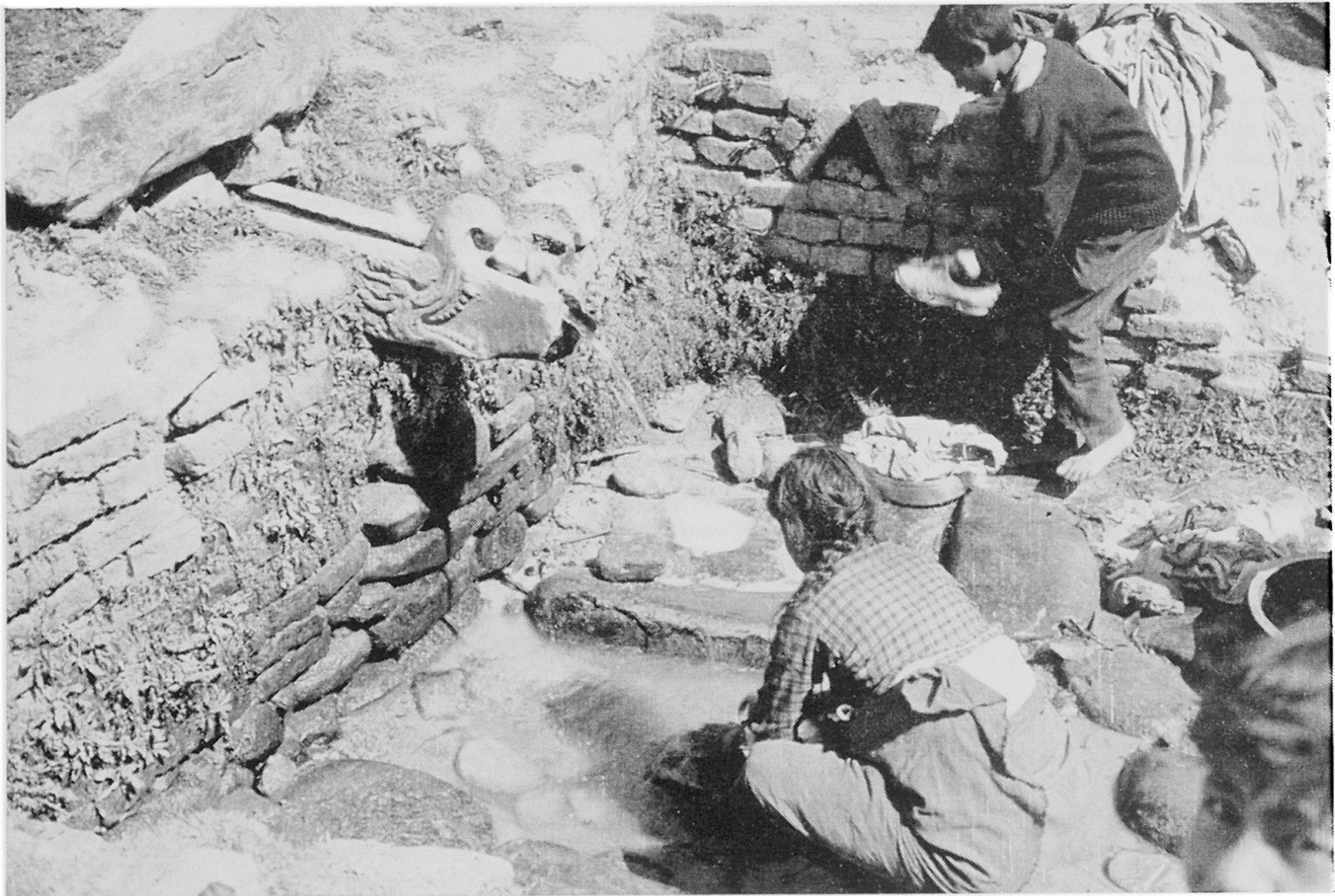
Abbildung 2. Quellfassung . Es handelt sich um eine kleinere Anlage östlich von Thecho (südlich des Kartenrandes), jedoch genau an der im Text beschriebenen Kontaktfläche von Mergeln und Schottern. Außer dem schön behauenen Wasserspeier beachte man auch die flachen Steine im «Trog», auf welchen die Wäsche durch Aufklatschen gereinigt wird. Töpfe zum Wegtragen von Verbrauchswasser. Aufnahme HB März 1971

Einfach ist die Frage nach dem Stauhohizont zu beantworten. Als solcher kommt nur die Auflageungsfläche der Schotter auf die Mergel in Frage. Die einzige und auf den ersten Blick erstaunlichste Ausnahme bildet die am nördlichen Stadtrand von Patan vorhandene Folge von drei benachbarten Brunnen. Den obersten findet man genau an der zu erwartenden Stelle, nämlich auf der Höhe der erwähnten Grenzfläche. Dann folgen jedoch in tieferer Lage noch zwei kräftig fließende Brunnen. Eine erste Vermutung, daß möglicherweise das überfließende Wasser von einem Brunnen zum andern geleitet werde, kann leicht durch die Sauberkeit des Wassers und die sichtbar vorhandenen Abflußrin-