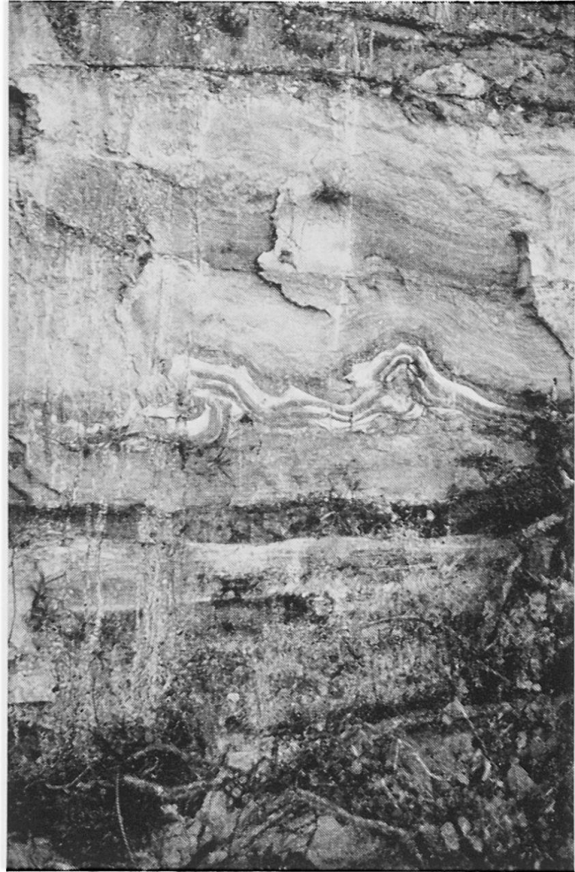
Abbildungen 4 und 5. Details der geologischen Verhältnisse . Links (Abb. 4) erkennt man die diskordante Auflagerung von Schottern der Patan-Serie auf die sogenannten Kalamati-Mergel. An der Auflageungsfläche findet sich ein rostroter Bodenhorizont. Diese Aufnahme wurde etwa 200 m vom Gebirgsrand entfernt nw von Godaveri gemacht (März 1972). Abb. 5 (rechts) zeigt ein Beispiel der Strukturen, welche man in den Kalamati-Mergeln findet. Hier handelt es sich um synsedimentäre Rutschungen, welche zu Faltungen und Aufschiebungen führten. Aufnahme s von Bughmati. Höhe des Aufschlusses etwa 2 Meter (März 1972)

gegen nur längs den auf der Karte eingezeichneten Hauptfließrichtungen. Vor allem im Stadtteil Mangalbazar gibt es außerdem große Vertiefungen, die den aus Indien bekannten tanks gleichen. Einzelne haben eine normale rechteckige Form. Einer von ihnen ist um die große Stupa angelegt und besitzt einen äußerst komplizierten und in seiner Entstehung sagemuwobenen Grundriß. In den letzten Jahren waren die meisten dieser tanks ausgetrocknet; sie werden zunehmend als Bauland Verwendung finden.