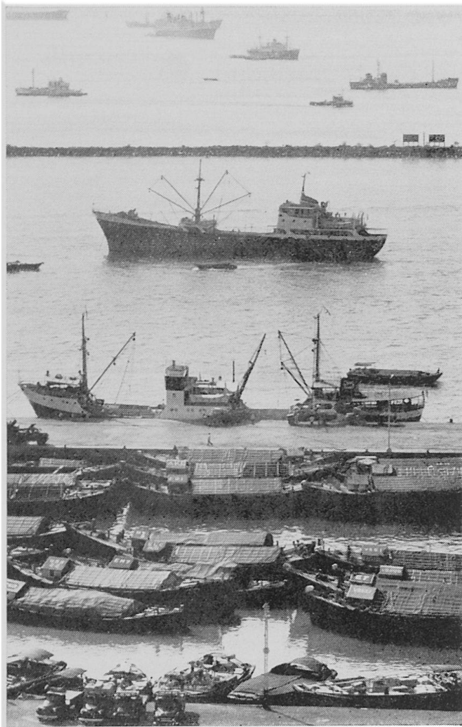
Abbildung 2. Eine Mole trennt «Outer Roads» von den seichteren «Inner Roads». Im Vordergrund der neue Leichterhafen «Telok Ayer Basin». Man erkennt den mühsamen Umschlag mit Autokranen und Kulis.

vollendet. Mit der vollständigen Inbetriebnahme der drei Anlegeplätze mit total 914 m Kailänge und 13,4 m Wassertiefe kann Mitte 1973 gerechnet werden. Eine weitere Anlegestelle von 213 m Länge und 10,4 m Wassertiefe dient den sog. «Feeder service vessels». Die Gesamtkosten für den Bau des Containerhafens betragen 137 Millionen sing. $, einschließlich über 30 Millionen sing. $ für mechanische Ausrüstungen, darunter 6 Containerkrane (35,5 t Tragkraft), 18 Großumladegeräte (Straddle-Carriers), 3 Schlepp- und Schubboote mit je 30 t Zugkraft, Brückenwaagen (60 t), Beleuchtungsanlagen und Bunkerpipelines (1 sing. $ = sFr. 1.32.) Mit einem Umschlagplatz von insgesamt 28 ha kann der Terminal ca. 8000 Container, einschließlich Kühlcontainer aufnehmen (bei 2-Container-hoher Stapelung), und man rechnet mit einem optimalen Umschlag von 3 Millionen t Gütern pro Jahr. Für 1972 werden 38 000 Container,