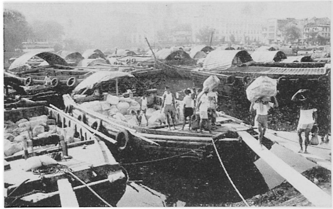
Abbildung 3. Traditioneller Umlad von Waren im Singapore River, hier Rubber Sheet-Ballen von 125 kg Gewicht, mit Hilfe von Kulis oder Auto-kranen. Diese hölzernen Leichter bedienen die in den «Outer Roads» ankernden Frachtschiffe. (Photo RS, April 1971)

vollendet. Mit der vollständigen Inbetriebnahme der drei Anlegeplätze mit total 914 m Kailänge und 13,4 m Wassertiefe kann Mitte 1973 gerechnet werden. Eine weitere Anlegestelle von 213 m Länge und 10,4 m Wassertiefe dient den sog. «Feeder service vessels». Die Gesamtkosten für den Bau des Containerhafens betragen 137 Millionen sing. $, einschließlich über 30 Millionen sing. $ für mechanische Ausrüstungen, darunter 6 Containerkrane (35,5 t Tragkraft), 18 Großumladegeräte (Straddle-Carriers), 3 Schlepp- und Schubboote mit je 30 t Zugkraft, Brückenwaagen (60 t), Beleuchtungsanlagen und Bunkerpipelines (1 sing. $ = sFr. 1.32.) Mit einem Umschlagplatz von insgesamt 28 ha kann der Terminal ca. 8000 Container, einschließlich Kühlcontainer aufnehmen (bei 2-Container-hoher Stapelung), und man rechnet mit einem optimalen Umschlag von 3 Millionen t Gütern pro Jahr. Für 1972 werden 38 000 Container,