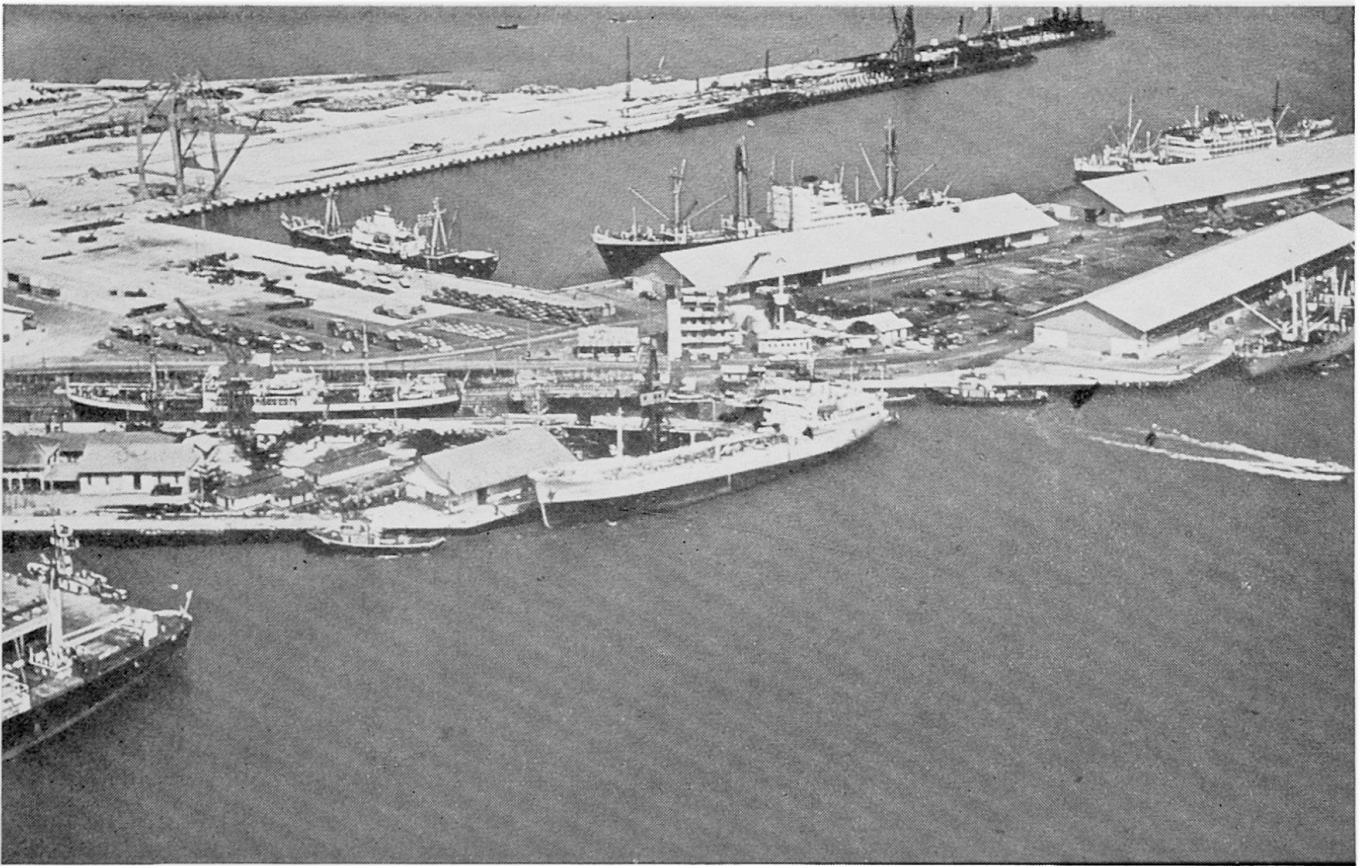
Abbildung 4. Gesamtansicht des Containerhafens. (Photo PSA, Dezember 1971)

gen in Kuala Lumpur und Djakarta daher ein Prüfungsrecht beanspruchten. Bereits zur Regierungszeit Präsident Sukarnos zeigte sich ein Abrücken von der Regelung während der Kolonialzeit, indem die Inlandgewässer nicht wie bisher um jede Insel gemessen und die dazwischenliegenden Meere als internationale Gewässer betrachtet werden sollten, sondern eine sog. Basislinie , die die äußersten Inselpunkte Indonesiens verbindet, als Begrenzung dieser Inlandgewässer dienen soll. Im Gegensatz zu den Territorialgewässern ist in Inlandgewässern die sog. «harmlose Passage» nicht erlaubt. Glücklicherweise hat Indonesien bisher von diesem einseitig proklamierten «Recht» nie Gebrauch gemacht, sich aber eine Anwendung vorbehalten. Konkreter ist nun allerdings die bereits erwähnte Ausdehnung der Territorialgewässer für die Schifffahrt in der Malakka-Straße geworden. Sollte dieser seit Jahrtausenden internationale freie Wasserweg nationalisiert werden, und müßte man mit Durchfahrtgebühren oder Sperrungen rechnen, wäre Singapurs Rolle als wichtigstes Handels- und Dienstleistungszentrum SE-Asiens gefährdet. Dementsprechend hat die Regierung des Stadtstaates diese Erklärung nicht unterzeichnet und sich während der Konsultationen für einen möglichst ungehinderten internationalen Verkehr ausgesprochen. Mit der Frage der Rechtmäßigkeit der «Nationalisierung» wird