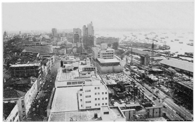
Abbildung 1. Das Hauptgeschäftszentrum Singapurs liegt an der Mündung des Singapur Rivers. Neben kolonialen Bauten ragen neuere Bürohäuser empor. Das Urban Renewal Programme sieht hier eine Massierung von Hochbauten vor, mit deren Errichtung bereits begonnen wurde.

Die erforderliche Lagerhausfläche berechnet sich nach einem Erfahrungswert, demzufolge 10 t