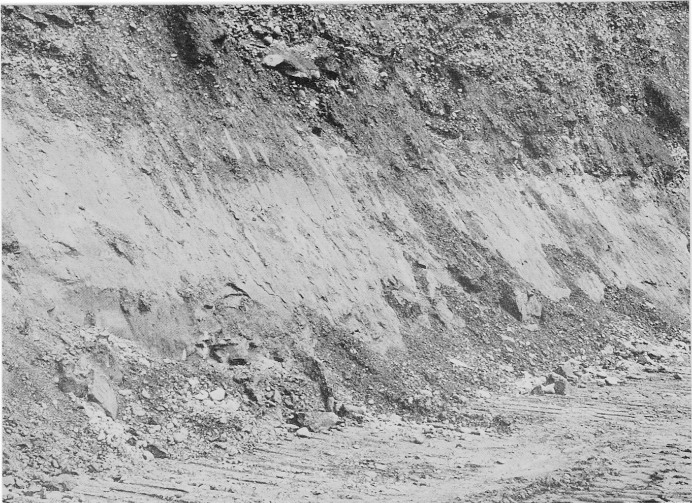
Abbildung 2. Detailaufnahme der Schotterunterkante in den Witschgenächern unterhalb Windlach