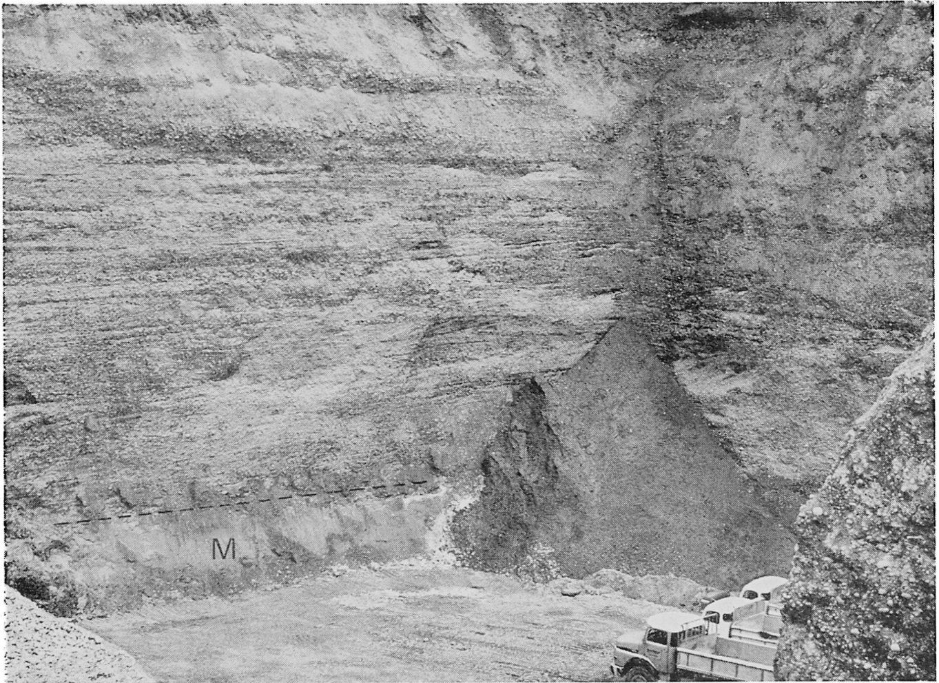
Abbildung 1. Kontaktzone Molassesandstein – Würmvorstoßschotter in den Witschgenächern unterhalb Windlach. Der Aufschluß ist Ende September 1972 durch Auffüllmaterial zugedeckt worden

kann auch in der Kiesgrube Hildenbrand unterhalb des Schützenhauses Windlach (Koordinaten 678 050/267 200) gemacht werden. Der Sandanteil zwischen den sehr schlecht zugerundeten Steinen ist hier minimal. Handelt es sich um ausgeschwemmtes Moränenmaterial? Des bedeutenden Sickerverlustes wegen sind die Böden sehr trocken (Ortsbezeichnung: «Im dürrn Hag»).