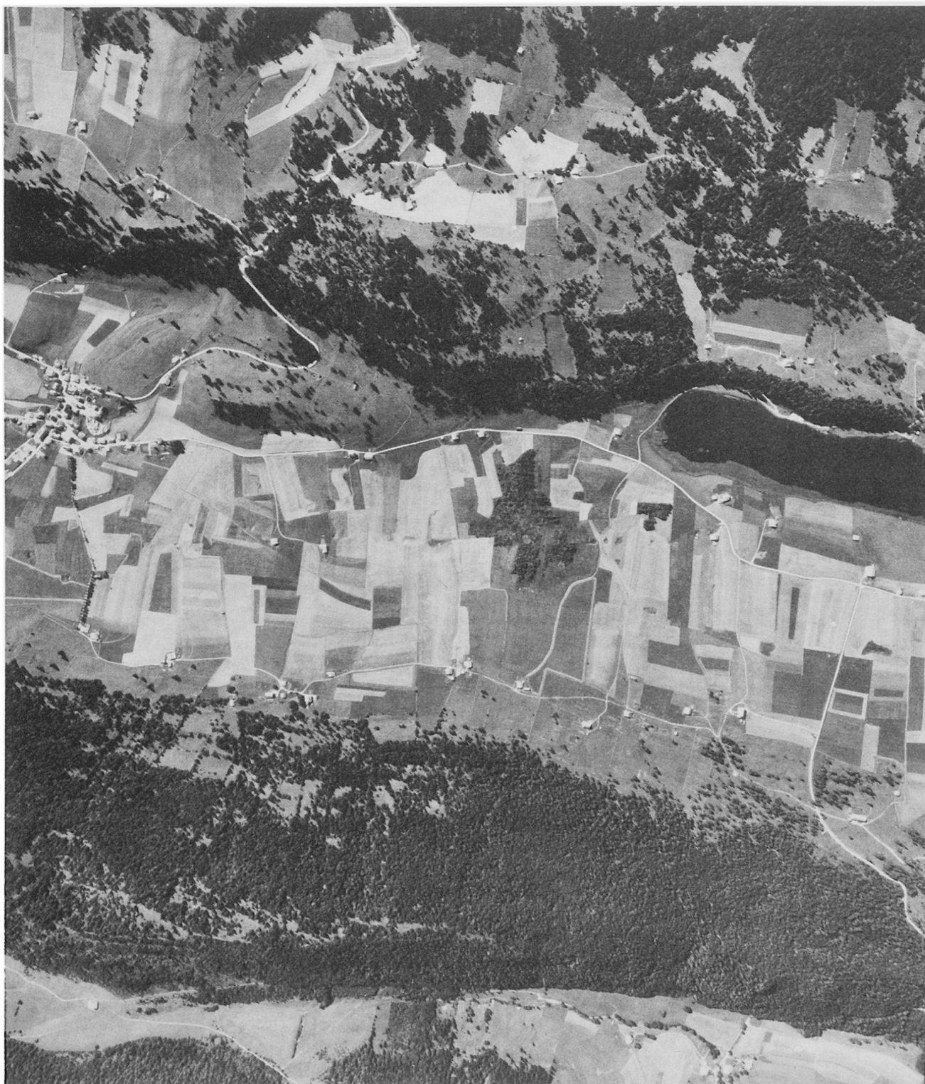
La Brévine im Neuenburger Jura (links) und Lac de Taillères (rechts). Man beachte die beidseits dem Talrand entlang gereihten Einzelhöfe mit ihrer Waldhufenflur.