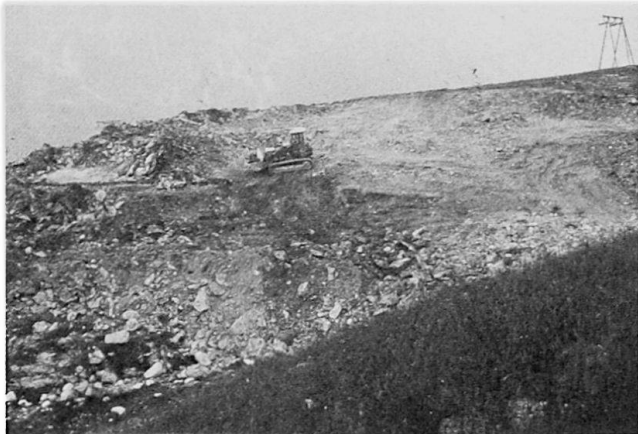
Landschaftsschäden durch Erdplanierungen. Ortsbestimmung: Piz Nair-Gebiet St. Moritz, Alp Giop Aufnahme: 21. 7. 1976

Erosionsherde entstehen, sondern auch beim Erstellen von Anlagen, wie zum Beispiel einzelner Stationen, Mastenfundamente, Leitungs- und Kabelgräben. Aber auch die Lagerung der oft beträchtlichen Aushubmassen in Steilhängen und ihr geländegerechter Dauer-einbau können Schwierigkeiten bereiten.