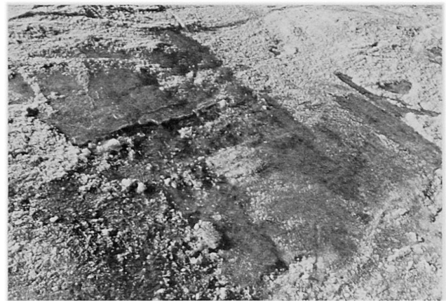
Eisbildung auf einer Abfahrts piste im Pizolgebiet. Ortsbestimmung: Gondelbahn Wangi-Pizol (Furt) Aufnahme: 3. 3. 1976

Durch die Pistenpräparierung mit Pistenfahrzeugen wird der Schnee zusammengedrückt. Dieser Verdichtung der Schneedecke hilft der Skifahrer durch das ständige Benützen der Skipiste noch zusätzlich nach. Durch diesen Druck entsteht eine Eisdecke, die je nach Witterungsverhältnissen und Pistenfrequentierung verschieden dick sein kann. Regnet es im Verlauf des Winters auf die Piste und folgt nachher eine Kälteperiode, wird die Eisbildung besonders gefördert. Eine entscheidende Rolle spielen dabei auch die Höhe der Schneedecke und die Exposition des Geländes. Der größte Prozentsatz der Ertragsausfälle für die Berglandwirtschaft geht auf das Konto der Pistenpräparierung. Unter der verfestigten Piste gehen viele wertvolle Futterpflanzen zugrunde. Dies ist nicht nur eine Folge der Verdichtung des Bodens, sondern auch des Sauerstoffmangels unter der Schneedecke, denn dadurch treten Erstickungs- und Fäulniserscheinungen auf. Zudem bewirkt die Eisdecke, daß die Skipistenflächen im Frühjahr später ausapern, was einen Vegetationsrückstand zur Folge hat. Dies wirkt sich negativ auf den Ernteertrag aus. Die Zeit zur Erholung