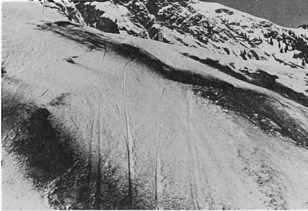
Landschaftsschäden infolge Schneemangels. Ortsbestimmung: Pizolgebiet beim Skilift Furt-Gaffia Aufnahme: 3. 3. 1976

wodurch diese erheblich verletzt oder sogar vollständig abrasiert wird. Zudem kommt es relativ häufig vor, daß in Kurven, an erhöhten Stellen und Wegbordrändern der Schnee bis auf den Boden weggeschabt wird, so daß an solchen Orten oft ein 100%iger Ertragsausfall hingenommen werden muß.