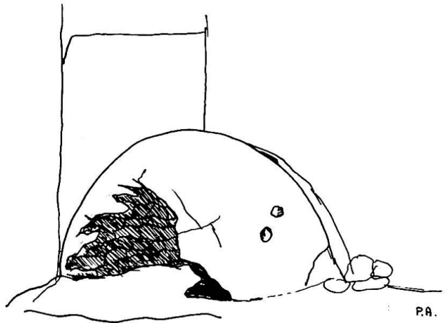
Fig. 3: Freistehender Backofen im Ortsteil Piscità, zerfallend. Diese ursprünglichen Typen wurden wohl wegen der Brandgefahr vom Haus entfernt erstellt (nach Famularo).

Fig. 2: Haus am Strand von Ficogrande (neben Hotel Sirenetta). Zur Zeit unbewohnt, relativ schlechter Bauzustand. 2 Räume im Untergeschoß, 2 im Obergeschoß. 2 Backöfen. «Bauern-Fischer-Haus».