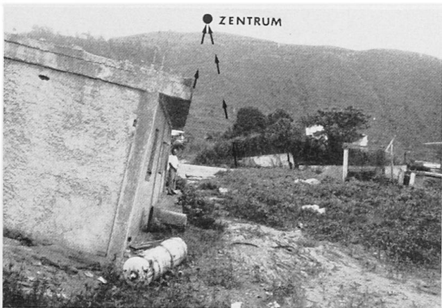
Bild 3 Rotationsförmige Sackung und Wirkung auf Bauten (bei Caracas, Venezuela).