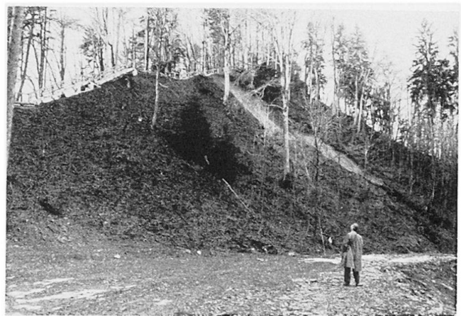
Bild 4 Durch Forststraße induzierter Berggrutsch (am Üetliberg-Kulm bei Zürich).