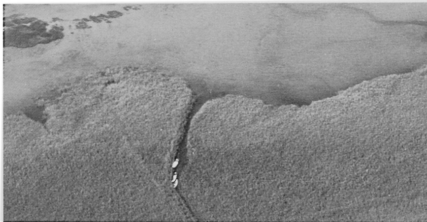
Abb. 2: Freiraumtyp