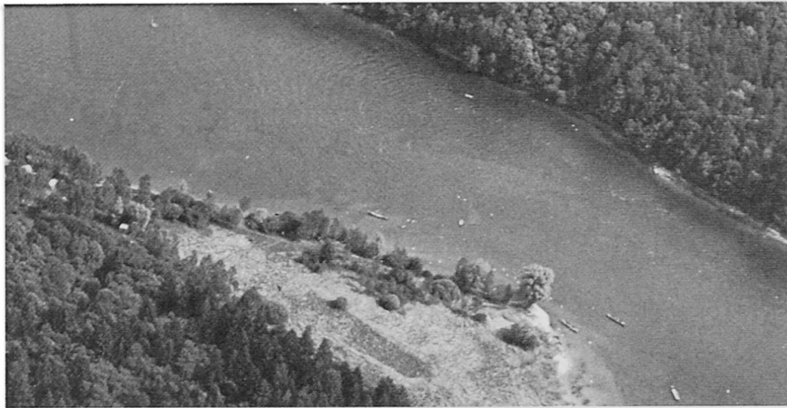
Abb. 1: Wandertyp