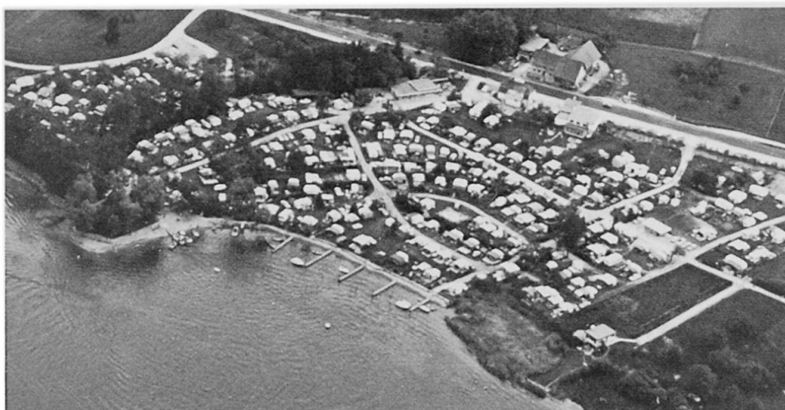
Abb. 3: Lagertyp