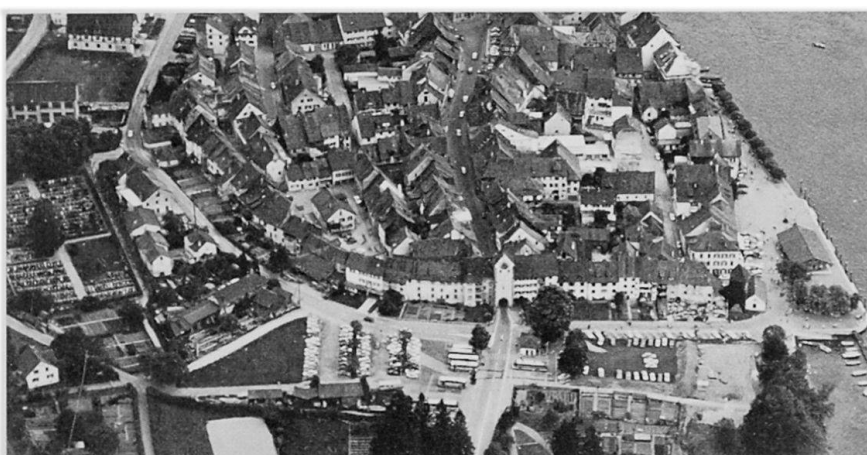
Abb. 4: Rundfahrttyp