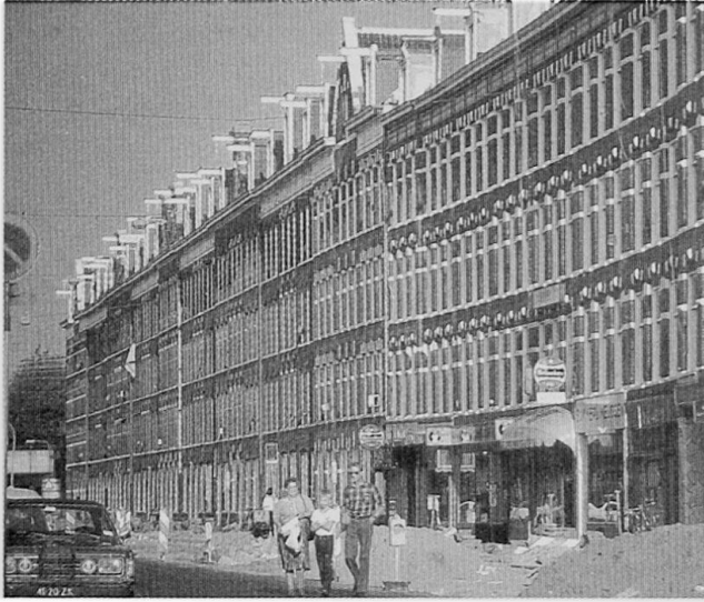
Abb. 2: Entvölkerungsprobleme der Industrienationen: der Stadtbewohner meidet immer mehr die Kerngemeinden grosser Agglomerationen der Randstadt, deren Lebensqualität den heutigen Anforderungen nicht mehr genügt (Amsterdam, 93. Quartier).