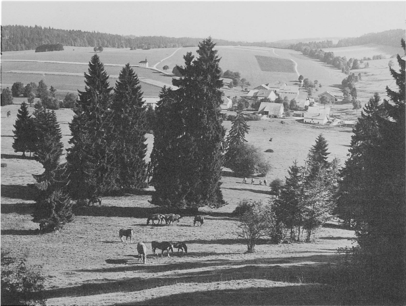
Les Franches-Montagnes (Jura).

Le canton de Neuchâtel par exemple a balisé toute une série d'itinéraires