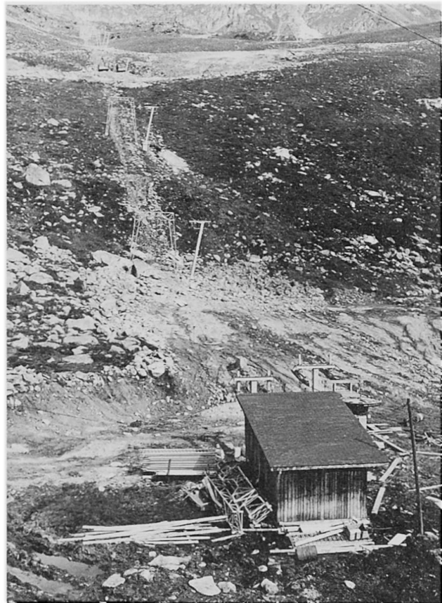
Abb. 1 Geländeplanierungen in der Umgebung einer Skiliftstation

Geländeplanierungen im Zusammenhang mit den Skiabfahrtspisten gehören heute zum gewohnten Bild einer touristischen Station (Abb. 1). Das Spektrum der