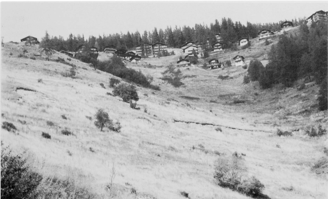
Noch ungelöstes Brachlandproblem in Chandolin, Val d'Anniviers (Aufnahme St. Julien).