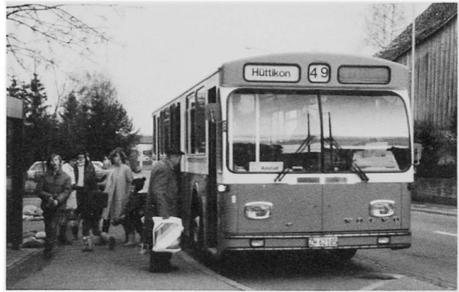
Abb. 4 VBRF-Bus am Dorfplatz. Der Regionalbus ist mit dem gegenwärtigen Fahrplan für Pendler unattraktiv.

Wurde in den vorangehenden Abschnitten die Pendlermobilität vor allem bezüglich der benutzten Verkehrsmittel und deren Begründung dargestellt, so steht in diesem Kapitel die individuelle Beurteilung des Arbeitsweges im Vordergrund. Es hat sich gezeigt, daß die große Mehrheit den jetzigen Weg zur Arbeit als akzeptabel hinnimmt (s. Tab. 6). 41% der Befragten finden allerdings, der Weg sollte nicht länger sein als jetzt, während 10% der Meinung sind, der Arbeitsweg dürfte noch länger sein, falls man dafür eine bessere Stelle oder Wohnung findet. Ein gewichtiger Teil der Befragten, fast 35%, wohnt seiner Meinung nach schon nahe oder ziemlich nahe beim Arbeitsplatz. Nur sechs der befragten Personen (= 9%) sähen es lieber, wenn der Arbeitsweg kürzer wäre. Um dies zu realisieren, müßte unter Beibehaltung der gleichen Arbeitsstelle ein Wohnungswechsel vorgenommen werden. Nur eine Person gibt aber an, daß sie bald umziehen wird. Hausbesitz, das Wohnen bei den