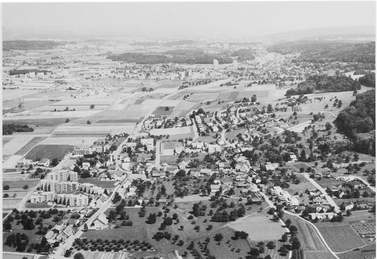
Abb. 3 Dällikon im Jahre 1977. Im Hintergrund Regensdorf und Zürich-Affoltern.