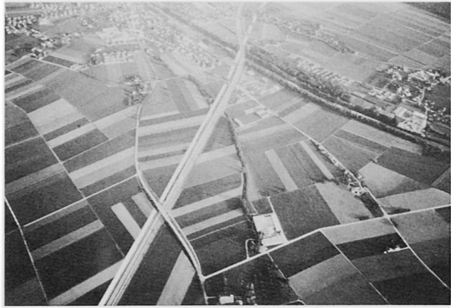
Aufnahme 3 (M. Wehrlin)

Als schwierig erwies sich die Formulierung von Alternativen zu einzelnen Streckenabschnitten. Wir entschlossen uns, Pläne und Profile mit den gleichen Elementen zu erstellen, wie sie von den SBB vorgelegt wurden. Auf eisenbahntechnische Einzelheiten mußten wir mangels Kenntnissen verzichten, aber die wichtigen Anliegen konnten so kompetent vertreten werden. Besonders bei der Diskussion um den