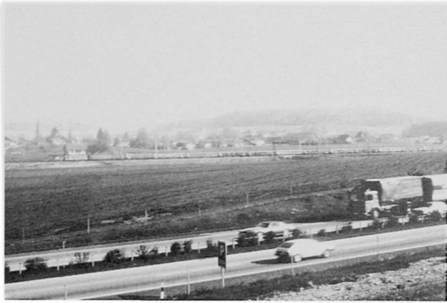
Aufnahme 1 Das Projekt der SBB hätte zwischen heutiger Linie und N1 mit einem Damm von 14 m Höhe die Ebene schräg zerschnitten.