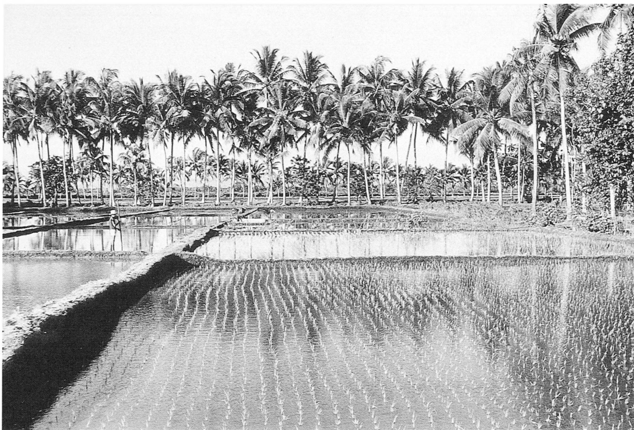
Fig. 3 Naßreisparzellen in der Alluvialebene von Südbali.

seln und wird den sogenannten «Inneren Inseln» Indonesiens zugerechnet. Im Gegensatz zu den «Äußeren Inseln» zeichnen sich «Innere Inseln» durch hohe Bevölkerungszahlen bei knappen Landressourcen aus. Als weltweit bekanntestes Eiland Indonesiens ist die «Insel der Götter» nicht nur die Provinz mit der größten Bevölkerungsdichte, sondern von der Zentralregierung der Republik Indonesiens auch erfolgreich zum Zugpferd der touristischen Erschließung des großen Archipels erkoren worden.