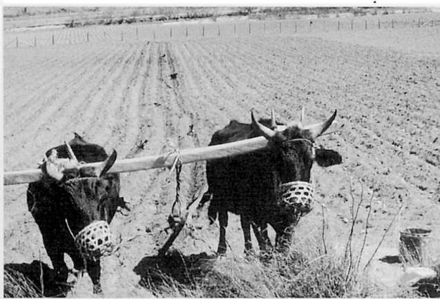
Abb. 4 Gespann beim Einpflügen der eben in die Furchen gelegten Kartoffeln. Die Zugarbeit auf dem Felde wird fast ausschließlich durch Stiere geleistet, mit deren Besitz auch einiges Prestige verbunden ist.

Erträge und Milchleistungen können mit den unseren nicht verglichen werden. So beträgt letztere, wenn eine Kuh überhaupt Milch liefert, infolge fehlender gezielter Zucht und Ausmerzungen alter Tiere (Tötungsverbot) sowie schlechter Futterbasis pro Tag meist weniger als ein Liter. Doch auch die zu zahlreichen männlichen Tiere werfen außer Mist, Zugleistung und Fleisch (in der Regel erst nach ihrem natürlichen Tod) verhältnismäßig wenig Nutzen ab, bringen aber, vor allem wenn es sich um große Stiere handelt, z. B. einen Mithun-Bullen, dem Besitzer einen beachtlichen Prestigeerfolg.