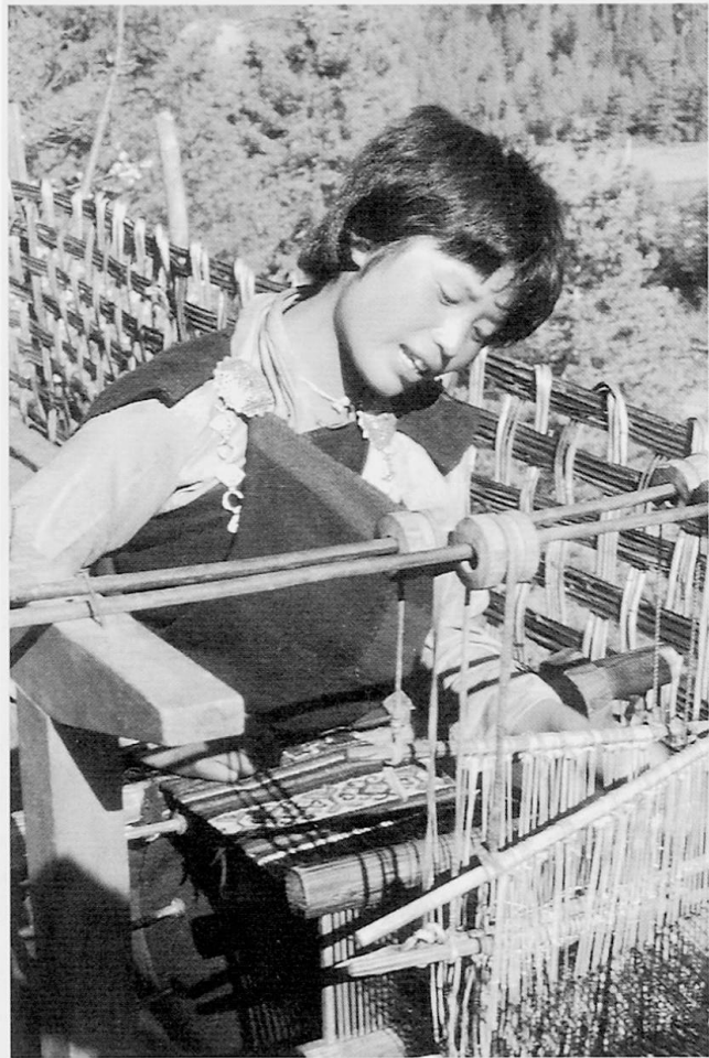
Abb. 2 Junge Frau im Chumee Valley beim Weben für einen lokalen Auftraggeber und Wiederverkäufer. Trotz geringem Verdienst zieht sie diese Tätigkeit, vor allem der sicheren Entschädigung wegen, der Arbeit auf dem Felde vor.

Kein Wunder, daß das touristische Interesse für Bhutan in Europa und anderswo längst geweckt worden ist. Doch