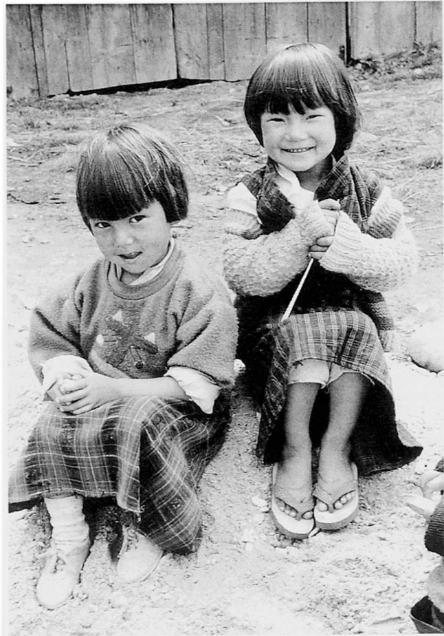
Abb. 7 Kinder in Bapalythang, Bumthangvalley.

Auch wenn seine Bewohner gegenüber einzelnen Teilen der Natur, so z. B. dem Wald oder streunenden Hunden, rücksichts- oder scheinbar gar lieblos handeln, so sind sie sich der Verantwortung in bezug auf die ganze Schöpfung