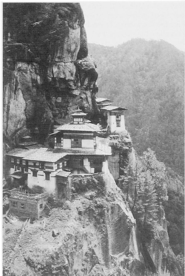
Abb. 6 Taktsang (Tigernest) ist das berühmteste Kloster des Landes. Hier soll, gemäß Legende, im 8. Jh. der verehrte buddhistische Lehrer Padmasambhava nach einem Ritt durch die Luft, auf einem Tiger von Tibet herkommend, gelandet sein.

Die Wahrheiten, daß Erkenntnis wichtiger ist als Glauben, Toleranz und Frieden stärker als die Gewalt sowie Vernunft über die Leidenschaft letztlich dominiert, werden hier nicht nur einfach verkündet, sondern vor allem auch gelebt. Oberstes Ziel ist dabei, durch wachsende Erkenntnis den Weg der Weltüberwindung zu gehen, d. h. sich von allen Wünschen und Begierden wie Habgier, Lust, Stolz usw. als den eigentlichen Ursachen der Wiedergeburt zu befreien und schließlich so den Zustand absoluter Leere, d. h. den Ort jenseits allen Leides, das Nirwana, zu erreichen.