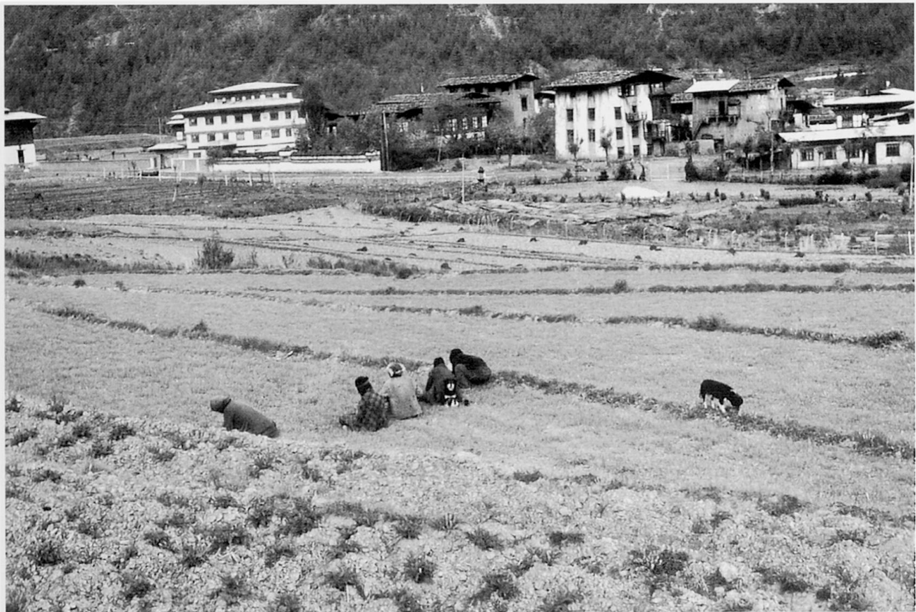
Abb. 3 Bauernfamilie beim Weeding (Unkrautauszupfen) in einem Reisfeld am Rande von Thimphu.

Da in der Landwirtschaft der menschliche Einfluß auf die Pflanzenwelt noch wesentlich stärker ist als beim Wald, ist auch die Bandbreite der Agrarlandschaften entsprechend groß: vom Reisanbau in Terrassen (bis etwa 2500 m) im Süden (Gerste reift in 60 Tagen noch auf 4500 m!) bis hinauf zu den höchsten Dauersiedlungen im Luanatal im Norden, wo auf 4000 m fast nur noch Viehzucht betrieben wird. Es kann hier also nur darum gehen, etwas Grundsätzliches und einige (noch) vorhandene Besonderheiten der bhutanischen Landwirtschaft schlaglichtartig aufzuzeigen.