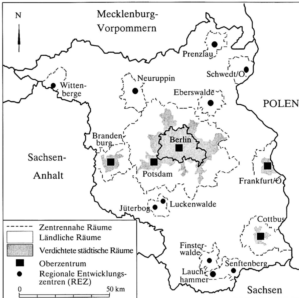
Abb. 3: Brandenburg: Raumkategorien der Landesplanung, 2000

Brandenburg: Spatial categories for planning purposes, 2000