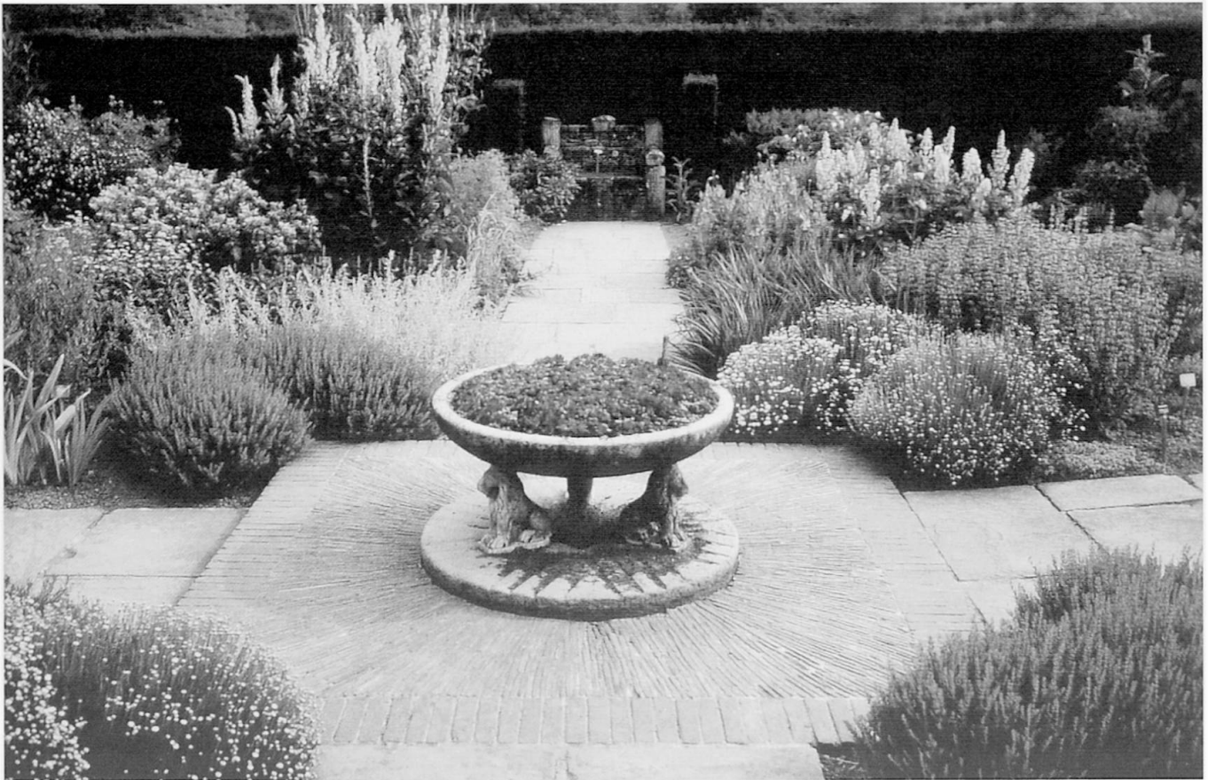
Abb. 4: Sissinghurst Castle: Kräutergarten Sissinghurst Castle: herb garden Sissinghurst Castle: jardin des herbes