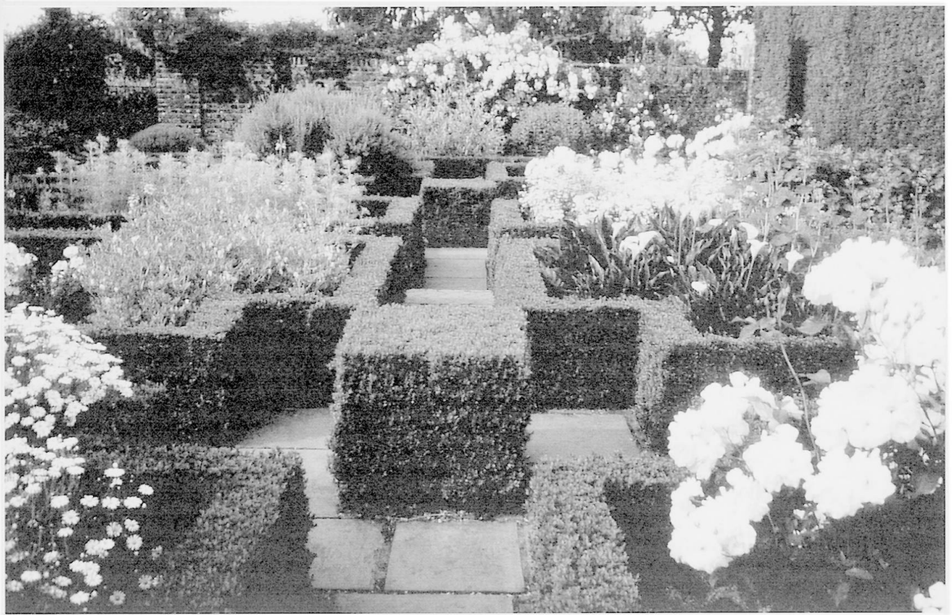
Abb. 3: Sissinghurst Castle: Weisser Garten Sissinghurst Castle: white garden Sissinghurst Castle: jardin blanc