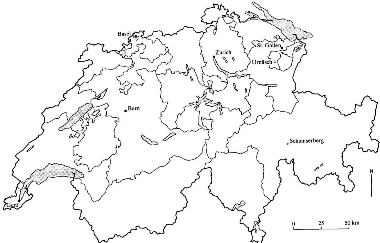
Abb. 1: Urnäsch und Schamsberg – Fallstudien aus dem Schweizer Berggebiet Urnäsch and Schamsberg – Case studies from Swiss mountain areas Urnäsch et Schamsberg – Etudes de cas dans les régions de montagne suisses Kartographie: V. SCHEURING

chung einbezogen, welche es erlaubten die theoretischen Konzepte zu vertiefen und zu differenzieren (GLASER & STRAUSS 1998: 53-83). Die Auswertung der Interviews erfolgte in einer computerunterstützten qualitativen Inhaltsanalyse (MAYRING 2000), welche eine detaillierte Auswertung der Daten ermöglicht hat.