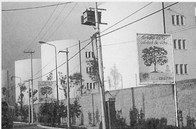
Foto 2: Der Wert der Lebensqualität, der Wert der Exklusivität: Werbung für ein condominio der Luxusklasse

Am deutlichsten wird dieser Prozess am Beispiel der Bildung von barrios cerrados . Mit Mauern oder Zäunen umgebene, mit privat finanzierten Sicherheitskräften oder -systemen ausgestattete, zum Teil auch mit hochwertiger, freilich nur den Bewohnern vorbehaltenen Infrastruktur (Sport- und Freizeitanlagen, z.T. sogar Bildungseinrichtungen) versehen, bilden diese geschlossenen Viertel hoch segregierte und sozial homogene Inseln im Stadtgefüge (Foto 2). Es handelt sich um Formen freiwilliger sozialräumlicher Segregation (vgl. zur Einordnung in die Segregations-theorie: BORSDDORF 2000). Die Grund- und Rahmenbedingungen der Entstehung sind bislang nicht vollständig erforscht. MEYER & BÄHR (2001: 316) und BORSDDORF (in diesem Heft, S. 241, Abb. 1) geben erste Erklärungsansätze. Vorläufig kann konstatiert werden, dass als Pullfaktoren das Motiv der Sicherheit (auch für die Kinder), die Möglichkeit des Zusam-