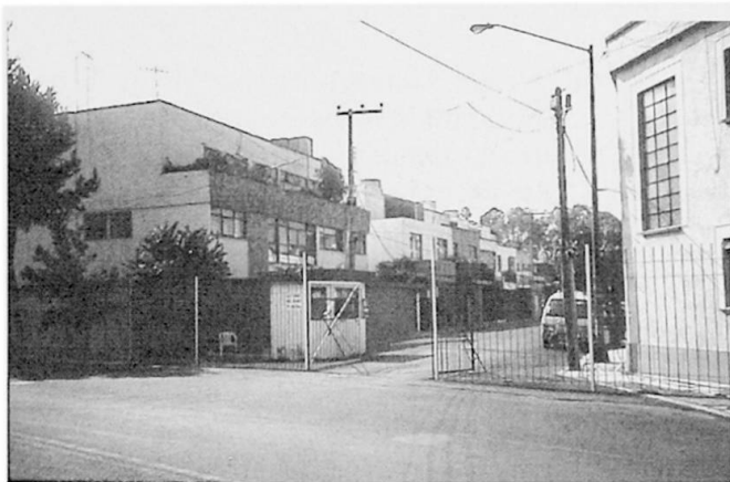
Foto 1: Abgesperrte Strasse in Mexiko-Stadt: Mit Gittern und Schranken wird öffentlicher Raum zum privaten umfunktioniert.

Closed road in Mexico City: Railings and barriers transform public space into private space.