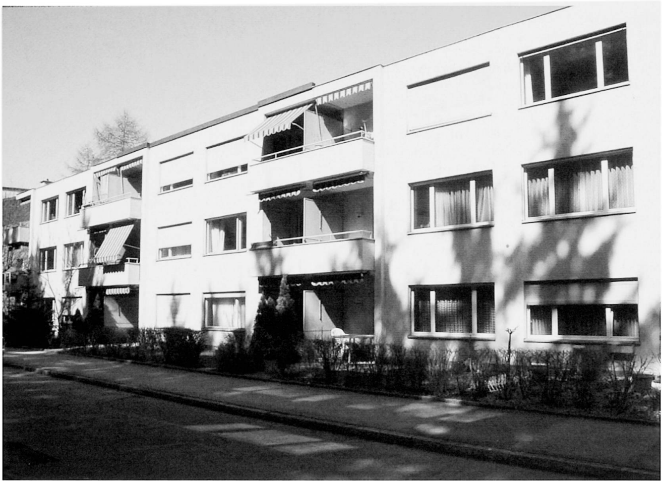
Foto 2: Typähnliches Bild für Wohnbaugenossenschaft B A representative image of communal housing development B Vue typique du bâti de la coopérative de construction B