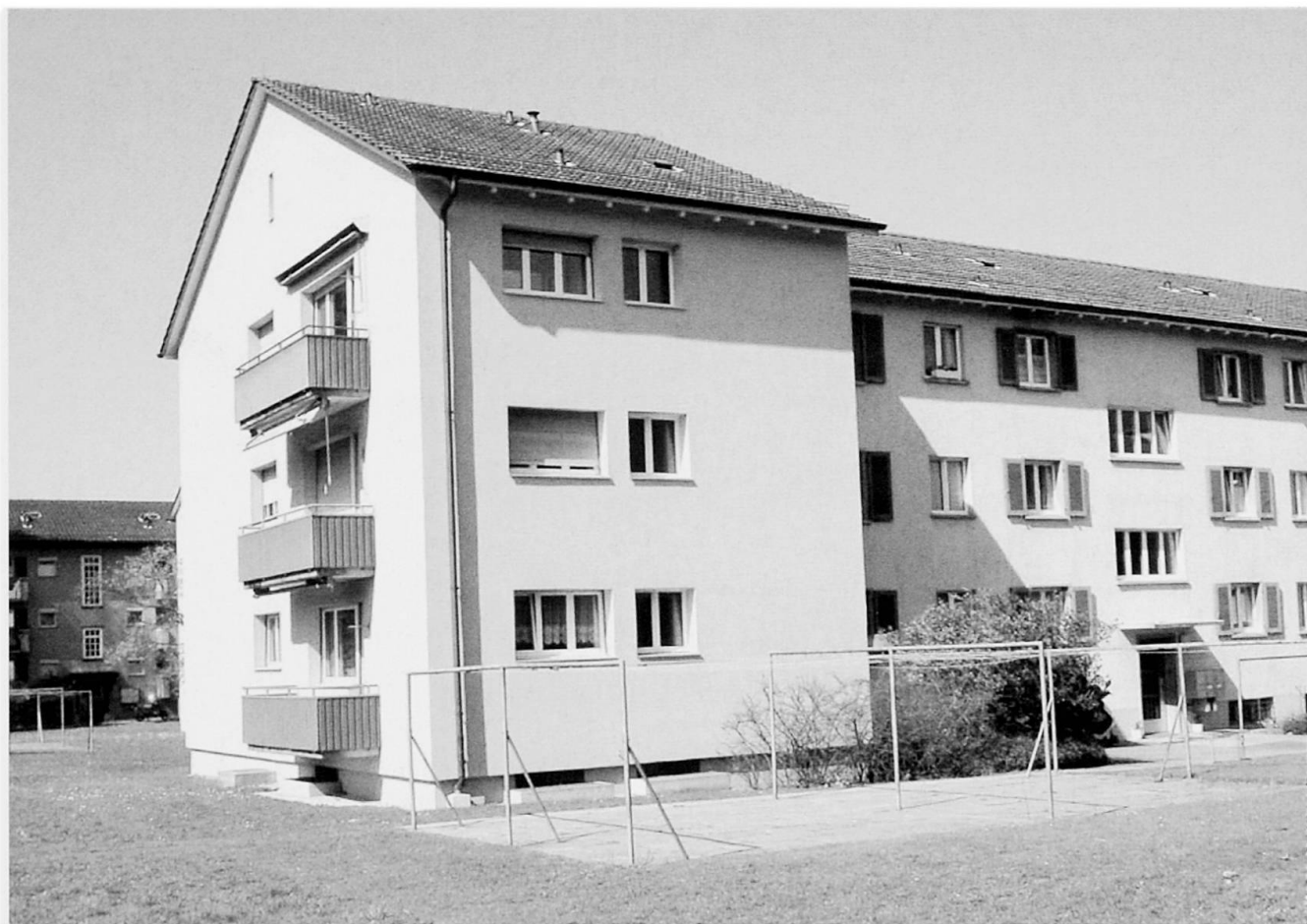
Foto 1: Typähnliches Bild für Wohnbaugenossenschaft A A representative image of communal housing development A Vue typique du bâti de la coopérative de construction A