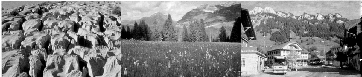
Abb. 1: Zonierung der UNESCO Biosphäre Entlebuch (UBE) (Foto 1: Kernzone: Naturschutzgebiet Schratzenfluh; Foto 2: Pflegezone: Moorlandschaft Habkern/Sörenberg; Foto 3: Entwicklungszone: Dorfzentrum Flühli) Zonation of UNESCO Biosphere Reserve Entlebuch (UBE) (Photo 1: Core Area: nature conservation area of Schratzenfluh; Photo 2: Buffer Zone: moorlands of Habkern/Sörenberg; Photo 3: Transition Area: centre of Flühli) Zonage de «UNESCO Biosphère Entlebuch» (UBE) (Photo 1: Aire centrale: réserve naturelle protégée Schratzenfluh; Photo 2: Zone tampon: Paysage marécageux Habkern/Sörenberg; Photo 3: Aire de transition: centre villageois de Flühli)