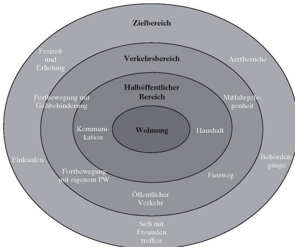
Abb. 2: Räumliches Umfeld im Alter Spatial environment of the elderly Contexte spatial des personnes âgées

Viele alte Menschen wünschen sich eine möglichst aktive und selbständige Nutzung des räumlichen Gefüges (FRIEDRICH 1995: 79), weshalb auch der öffentliche Raum für Betagte selbständig und möglichst gefahrlos zugänglich sein sollte. Ein selbständiges Sich-Zurechtfinden im öffentlichen Raum hängt daher wesentlich von der Nähe zu Infrastruktureinrichtungen wie Einkaufsmöglichkeiten, Ämtern oder öffentlichen Verkehrsmitteln ab. Eine verallgemeinernde Unterstellung von Gebrechlichkeit sollte aber vermieden werden, weil sie einer einseitig das Biologische betonenden Betrachtungsweise Vorschub leistet, auf deren Basis vor allem die Nähe zu Einrichtungen des Gesundheitswesens gefordert wird (LANDOLT 1999: 18). Vermeintliche Standortpräferenzen wie «Ruhe» oder «schöne Aussicht» in den Planungsprozessen öffentlicher wie privatrechtlicher Bauprojekte sind den Erkenntnissen der Altersforschung anzupassen.