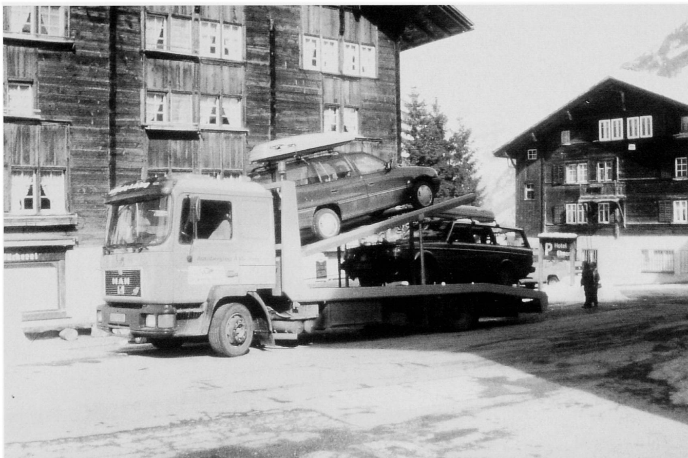
Abb. 2: Rückschaffung von während des Lawinenwinters 1999 in Elm (GL) zurückgelassenen Autos durch einen belgischen Abschleppdienst. Dieses Beispiel zeigt, wie auch weit vom Ereignisort entfernt angesiedelte Unternehmen von den Mehreinnahmen profitieren können, welche ein katastrophales Naturereignis verursacht.

Camion de dépannage belge ramassant des voitures abandonnées pendant les avalanches de l'hiver 1999 à Elm (GL). Cet exemple montre que même des entreprises situées très loin du lieu d'une catastrophe naturelle peuvent profiter des recettes supplémentaires causées par cet évènement.