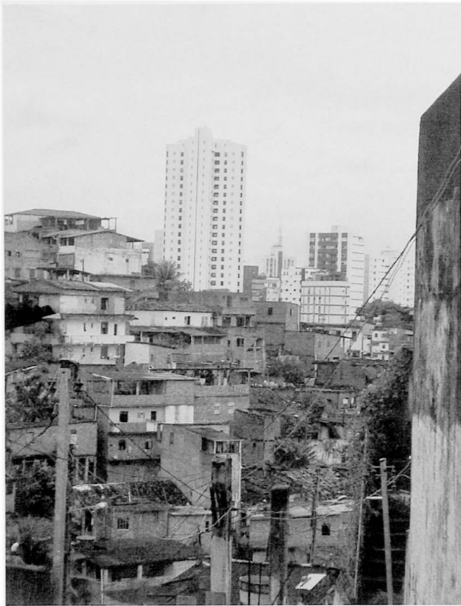
Foto 1: Unmittelbares Nebeneinander von Arm und Reich und infrastrukturelle Kontraste in Salvador: Blick von Calabar auf die direkt angrenzenden condomínios

Infrastructural contrasts in a financially mixed neighbourhood in Salvador: view from Calabar on the directly bordering «condomínios»