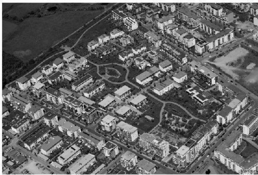
Foto 2: Unterschiedlich möblierte öffentliche Anlagen fungieren als Knotenpunkte der Wegenetze

Masterplan de Rieselfeld: accessibilité et possibilité de rencontres à travers des réseaux fonctionnels indépendants les uns des autres (transport motorisé individuel, transports publics, mobilité douce, chemins piétonniers)