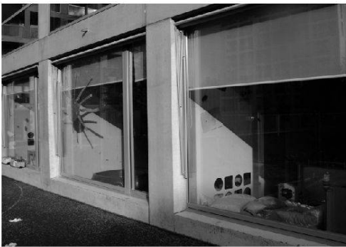
Foto 2: Nutzungsmischung in allen Erdgeschossen der sieben Wohnhäuser in der Werdwies (hier: die Kinderkrippe)

Lotissement de Werdwies: un aménagement urbain facilitant l'accessibilité et les possibilités de rencontres