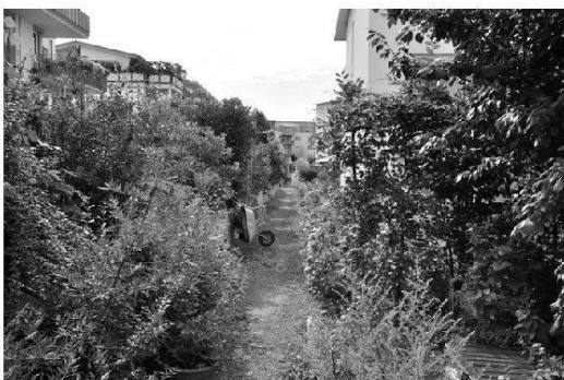
Foto 4: Barrierefreie Wege durch die Siedlung (hier Streifwege für Kinder)

Accessibilité constante dans tous les espaces publics et semi-publics (ici la mobilité douce)