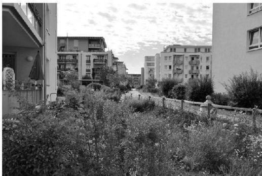
Foto 3: Durchgängige Barrierefreiheit in allen öffentlichen und halböffentlichen Räumen (hier Langsamverkehr)

Différentes installations publiques fonctionnant comme des nœuds dans les réseaux de chemins