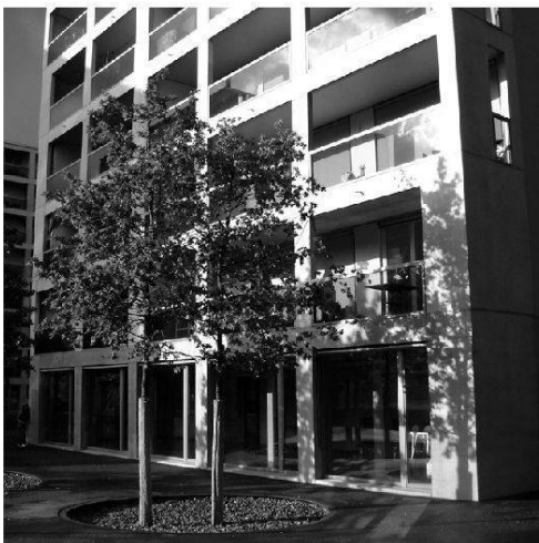
Foto 3: Durchgängige Barrierefreiheit in allen öffentlichen und halböffentlichen Räumen sowie in den privaten Innen- und Aussenbereichen der Wohnungen

Mixité d'usages à tous les rez-de-chaussée des sept maisons d'habitation du lotissement de Werdwies (ici la crèche)