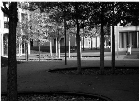
Foto 4: Freiraumkonzept und Erdgeschossnutzung: barrierefreie Wege durch die Siedlung, an alle angrenzenden Strassen sowie in alle gemeinschaftlichen und privaten Hauseingänge

Accessibilité constante à tous les espaces publics et semi-publics de même qu'aux parties intérieures et extérieures privées des logements