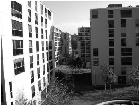
Foto 1: Wohnsiedlung Werdwies: Zugänglichkeit und niederschwellige Begegnungsmöglichkeiten durch einen städtebaulichen Planungsanspruch

Werdwies housing development: accessibility and open meeting areas in accordance with urban planning policy