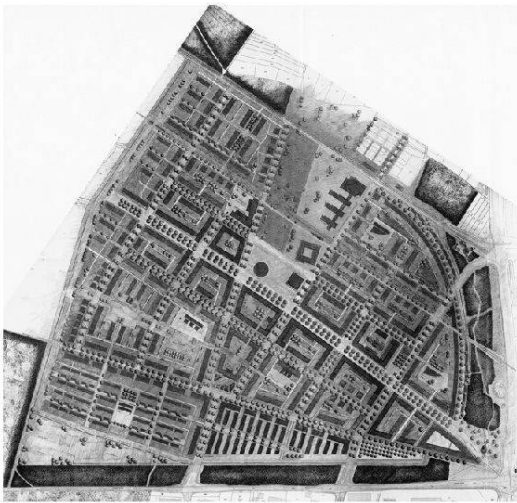
Foto 1: Masterplan Rieselfeld: Zugänglichkeit und niederschwellige Begegnungsmöglichkeiten durch unabhängig voneinander funktionierende Wegenetze (motorisierter Individualverkehr, öffentlicher Verkehr, Langsamverkehr, Streifwege)

Masterplan Rieselfeld: accessibility and open space meeting points ensured by independently functioning traffic networks (motorized individual transport, public transport, non-motorized traffic and pedestrian crossings)